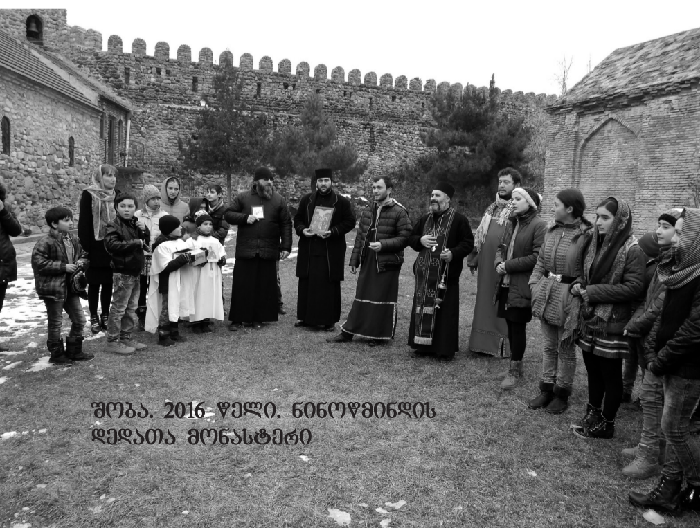
შობა, 2016 წელი. ნინოწმინდის ღვთისმშობლის ეკლესია

სულის ტკივილით მტკივა შენი ფერწასული სახე, ჭირისუფალით ცრემლით დაოსებული რომ გნახე. წარსულის ქანდივით გასახე გულზე ქარაგოზის ფერით, ქარცემულ ხესავით დგახარ,