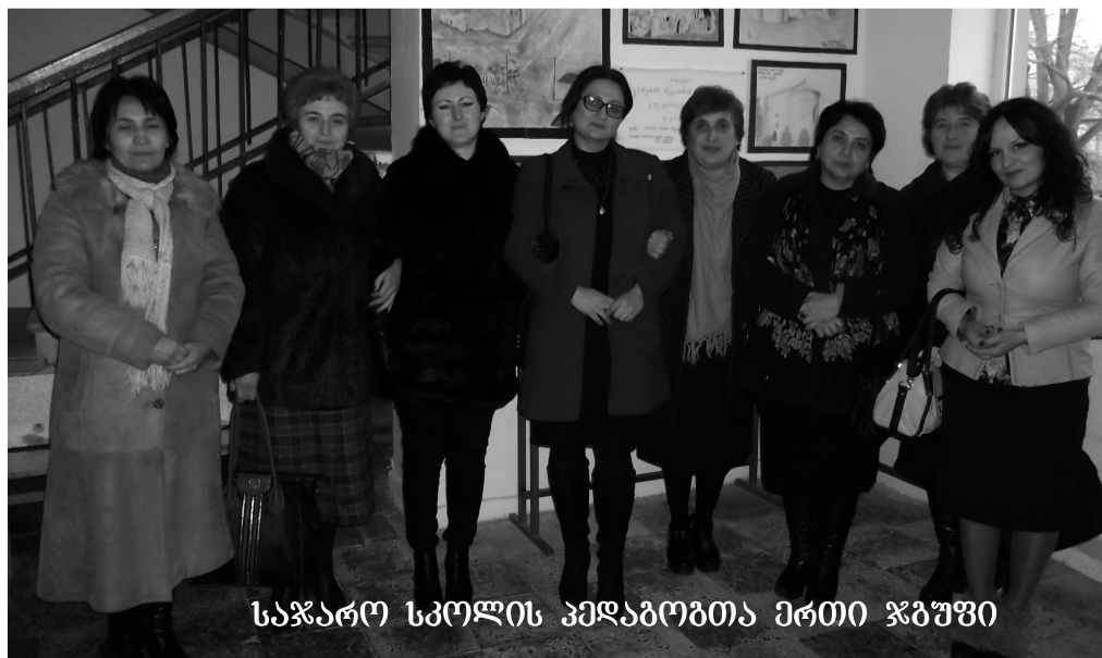
საჯარო სკოლის პედაგოგთა ერთი ჯგუფი

მოსწავლეთა რაოდენობა – 212; სულ მომსახურე პერსონალის რაოდენობა – 37, კლასების – 13; 2014-2015 სასწავლო წლის კურსდამთავრებული მედალოსნები – 1 ოქროს, 1 ვერცხლის; წარმატებული აბიტურიენტები – 7; სკოლის ინფრასტრუქტურა სასწავლო-სააღმზრდელო პროცესი პრობლემები – 2015 წლის ზაფხულში ჩატარდა