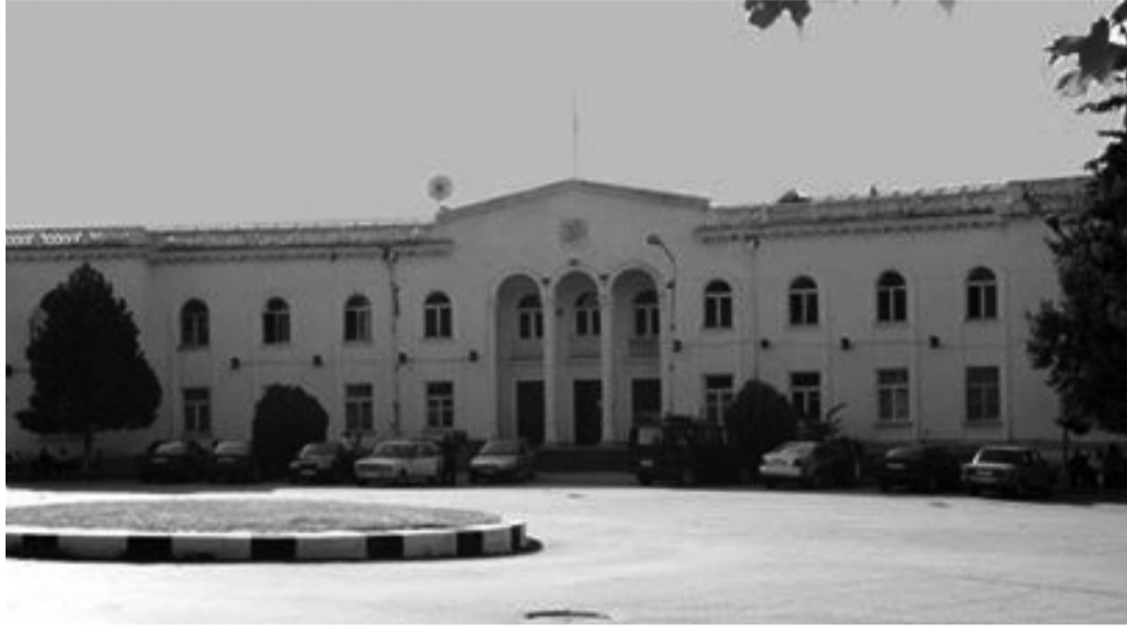
სახელმწიფო ბიუჯეტიდან გამოყოფილი.

ასევე, სოფლამო: 1. პატარძელში, ე.წ. „ჩიხლანთ უბანში“ , სადაც არასოდეს ყოფილა ასფალტის საფარი და სანიაღვრე არხები, მოასფალტდება უბნის გზა და მოეწყობა სანიაღვრე არხები, რაზედაც 350 ათასი ლარი იქნება