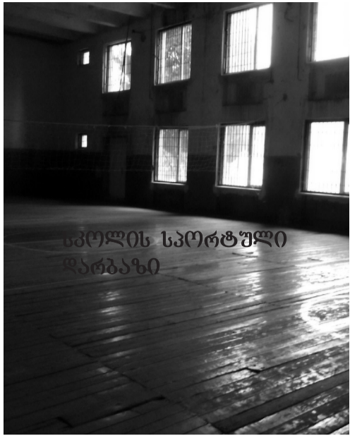
სკოლის სპორტული დარბაზი