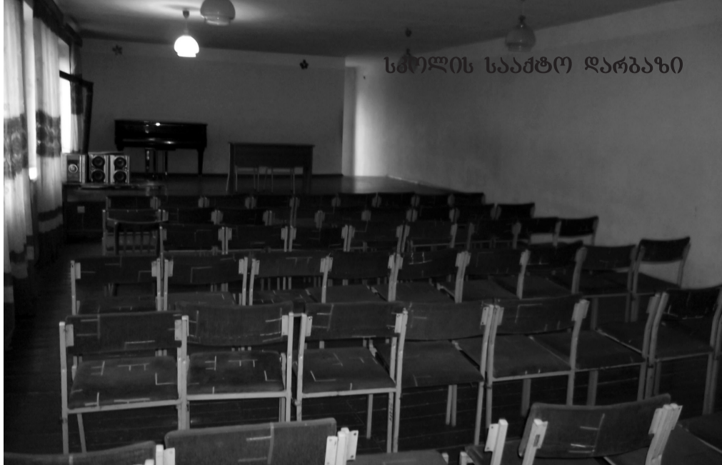
სკოლის სააბტო დარბაზი

მონასტერში შემოსული ადამიანი მბებრმა ერთად მიუვლოცეთ ნინოწმინდელს შობის დღესასწაული. ღოცვით და გალობით. შემოსული შემოწირულობით თვითონ ბავშვები დაეხმარნენ თავიანთ თანატოლებს და გვერდში დაუდგნენ. სწორედ ეს თანადგომა და ერთსულოვნება გვაკლია, გვაკლია და გვესაჭიროება დღეს ქართველებს. ღმერთმა დაგლოცოთ, გაგაძლიეროთ, წყალობა და მშვიდობა მოგვცეს უფალმა. გილოცავთ წმ. ნინოს სხენების დღეს და გელოდებით სადღესასწაულო წირვა-ლოცვაზე ნინოწმინდის მონასტერში 27 იანვარს. შეგვეწიოს წმ. ნინოს ღოცვა-კურთხევა საქართველოში მცხოვრებ ყველა ადამიანს, მივეყვებ პატრიარქის სიტყვებს „ქართველნი, ერთად ღვთისაყენ“ და ყოველთვის გვახსოვდეს, რომ – „ჩვენთან არს ღმერთი“.