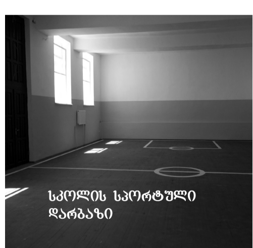
სკოლის სპორტული დარბაზი