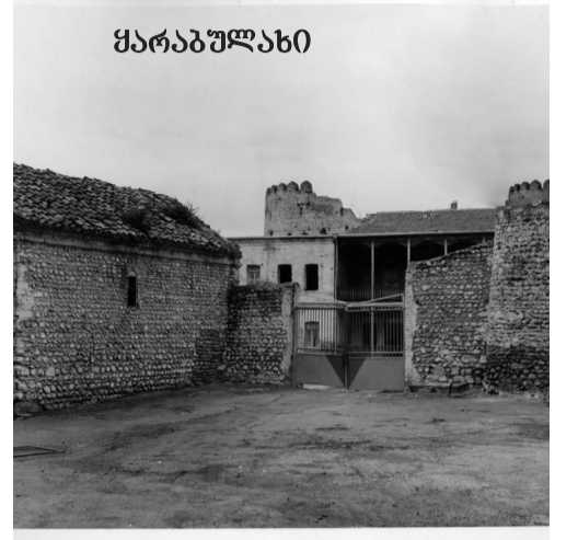
დღეს სოფელში ორი მოქმედი ეკლესიაა - წმინდა გიორგის და წმინდა ნიკოლოზის სახელობის.

ხელმძღვანელობამ რესტავრაცია ჩაუტარა რეზიდენციას. 90-იანი წლებიდან კი იგი თავის კანონიერ მფლობელებს - ყარაბულახელი ჩოლოყაშვილების შთამომავლებს დაუბრუნდა.