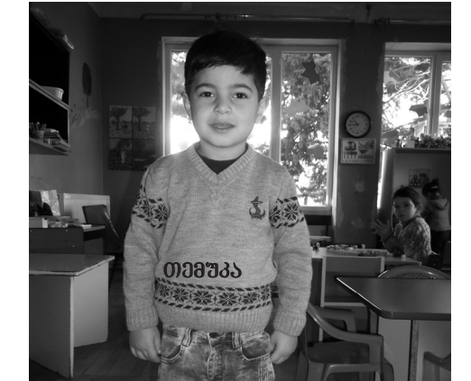
დასასრული მე-7 გვერდზე

გონები. სურათი გადავიღეთ და ბიჭები წამში ისე ჩამწკრივდნენ, ისე მოძებნეს ერთმანეთი, დიდხანს ვიცინოდი და მათთვის სურათის გადაღება ძლივს და მოვახერხე – ისინი კი იდგნენ და მოთმინებით ელოდნენ ჩემს დაშვიდებას. აი, ისინიც – ძმაცები და დიდი, დიდი მეგობრები. – ასეთი მეგობრული ურთიერთობა არც ერთ ჯგუფში, არც ერთ თაობაში არ მინახავს, – მეუბნება აღმზრდელი, რომელსაც ამ ბაღში მუშაობის 40 წლის სტაჟი აქვს, – საოცარი სიყვარულით არიან ერთმანეთის მიმართ, სულ ერთად უნდათ ყოფნა, არასოდეს კამათობენ, თამაშობენ ძალიან მშვიდად, არც გოგონებს აქცევენ ყურადღებას და არც მათ თოჯინებს აწიწნიან თმებს. აი, თუმცა ზალიკანიანი ნამდვილი ამხანაგია, დაბრძენებული, მშვიდი, გონიერი, ჩამოყალიბებული პიროვნებაა და