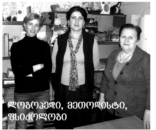
ლოგოპედი, მეთოდისტი, ფსიქოლოგი

როგორც საუბარში აღნიშნა, ერთეული შემთხვევები იყო და ზოგჯერ ახლაცაა აუტისტური სპექტრის აღსაზრდელებთან მუშაობის საჭიროება. მაგრამ ასეთი ბავშვები სწორი მიდგომით სძლევენ იმ პრობლემებს, რომლებიც აქვთ, ებმებიან თავიანთ თანატოლებთან ერთად ყოველდღიურ მეცადინეობებში, აქტივობებში მაგრამ, რაც მთავარია, ასეთებს მოყვება და სიყვარული სჭირდება. სწორედ ასეთი სიყვარულია და