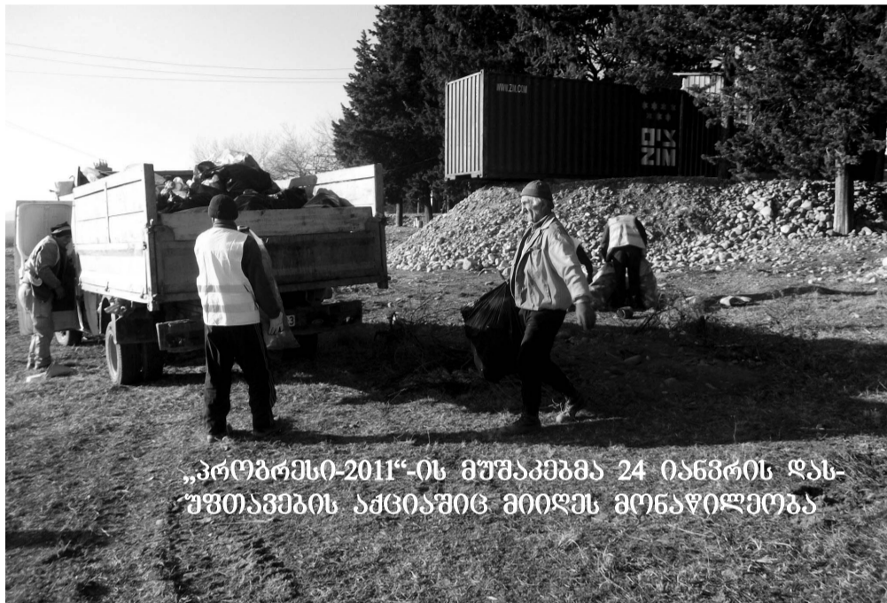
„პროგრესი-2011“-ის მუშაკებმა 24 იანვრის დასუფთავების აქციაშიც მიიღეს მონაწილეობა

აღრიან დილით, როცა საგარეჯოს მოსახლეობის უმრავლესობა ჯერ კიდევ ტაბილ სიზმრებშია გახვეული, ამ სამსახურის მუშაკები უკვე ქალაქის ქუჩებში არიან. პგვიან, ასუფთავებენ, საყოფაცხოვრებო ნარჩენებისათვის განკუთვნილ ურნებში აგროვებენ ზოგიერთი უპასუხისმგებლო მოქალაქეებისა თუ სხვა მიზეზთა გამო მიმოფანტულ საყოფაცხოვრებო ნარჩენებს და ნაგავსაყრელზე გააქვთ. ცხრა საათისათვის კი ქალაქის ქუჩები და სკვერები გაწმენდილ-გალამაზებული იერ-სახით ეგებებიან პირველ გამეღვლებს.