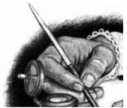
დალაგდნენ ლექსის ჯიქნებად ვგ შენი სანაპირონი

შენ დამარწიე, იორო, მანქვევ თავზე მირონი;