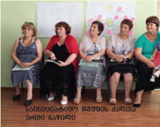
საინიციატივო ჯგუფის ქალთა ერთი ნაწილი