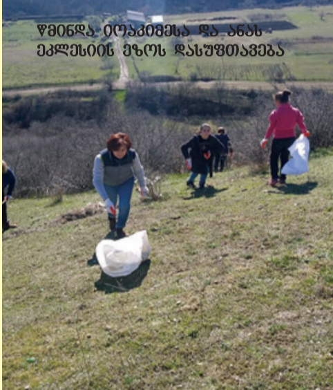
წმინდა ირაკლიძისა და ანას-ეკლესიის ეზოს დასუფთავება