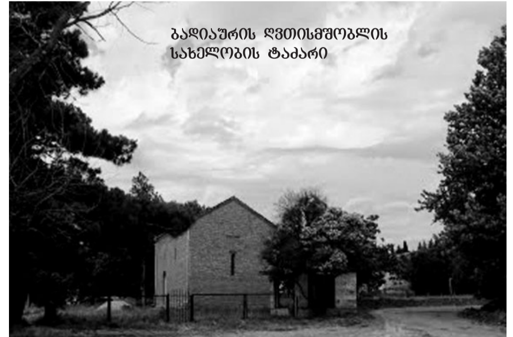
ბადიაურის ღვთისმშობლის სახელობის ტაძარი