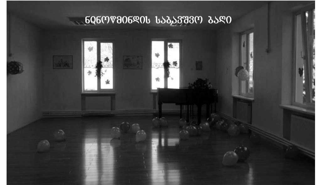
ნინოწმინდის საბავშვო ბაღი