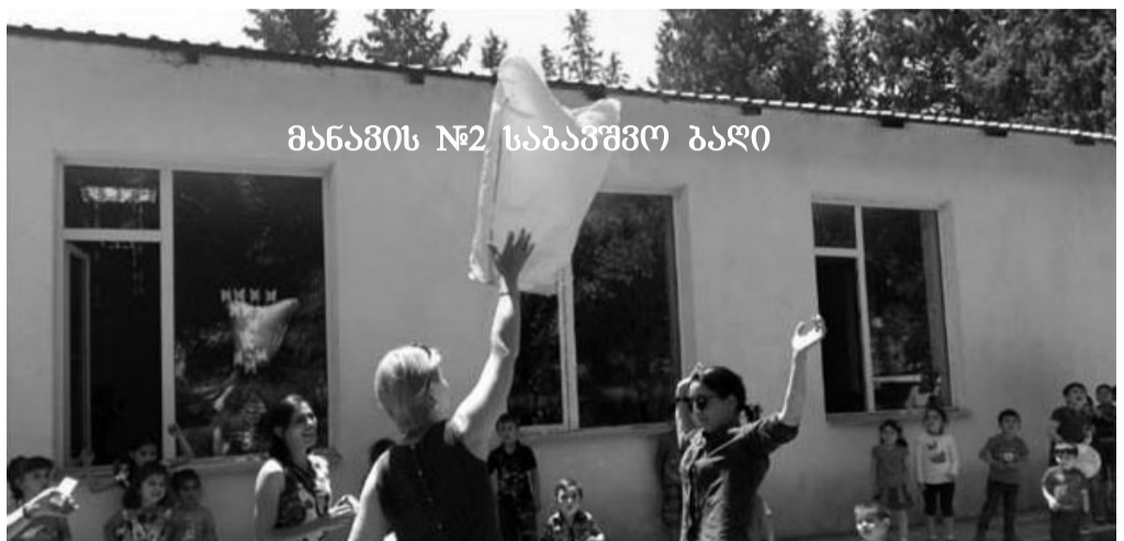
მანავის №2 საბავშვო ბაღი

2017 წელს ადგილობრივი ბიუჯეტიდან მოხდა მანავის №2 (ე.წ. „ბურდიანის დასახლების“) სკოლამდელი აღზრდის დაწესებულების (მენეჯერი მაია მირზაშვილი) სრული რეაბილიტაცია. აღნიშნული დაწესებულება გასული საუკუნის 80-იან წლებში იყო აშენებული და უკვე იმდენად დაზიანებული, რომ მათი დროებით გადმოყვანა მანავის №1 სააღმზრდელი დაწესებულებაში მოგვიხდა. რეაბილიტაციისთან ერთად, აქ მოეწყო ცენტრალური გათბობაც; საგარეჯოს №1 სკოლამდელი აღზრდის დაწესებულების (მენეჯერი თამარ ლაფერიშვილი) შენობის შესასვლელი გადაიხურა და მოხდა სველი წერტილების რეაბილიტაცია; საგარეჯოს №4 სკოლამდელი აღზრდის დაწესებულებაში (მენეჯერი ლილი ლოლაძე) ჩატარდა სასმელი წყლის სისტემის რეაბილიტაცია, №5 დაწესებულებაში (მენეჯერი მაია კოხტაშვილი) – გადაიხურა შენობის შესასვლელი; საგარეჯოს №2 სკოლამდელი აღზრდის დაწესებულებაში (მენეჯერი მაია ბეჟიტაშვილი) – დარ-