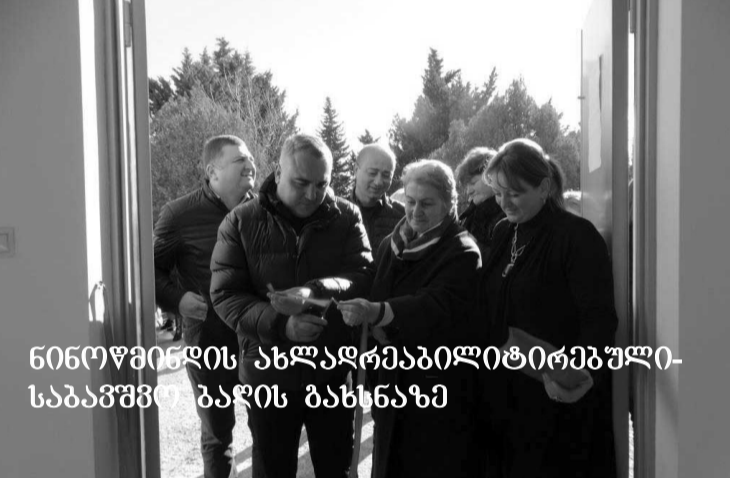
ნინოწმინდის ახლადრეაბილიტირებული-საბავშვო ბაღის გახსნაზე