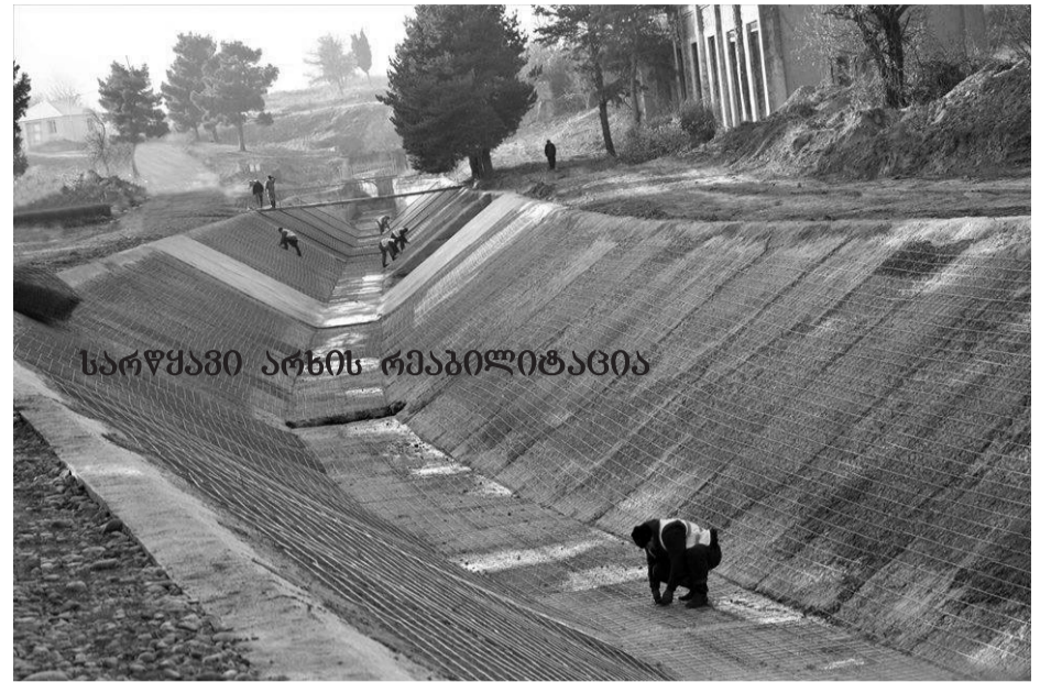
სარწყავი არხის რეაბილიტაცია