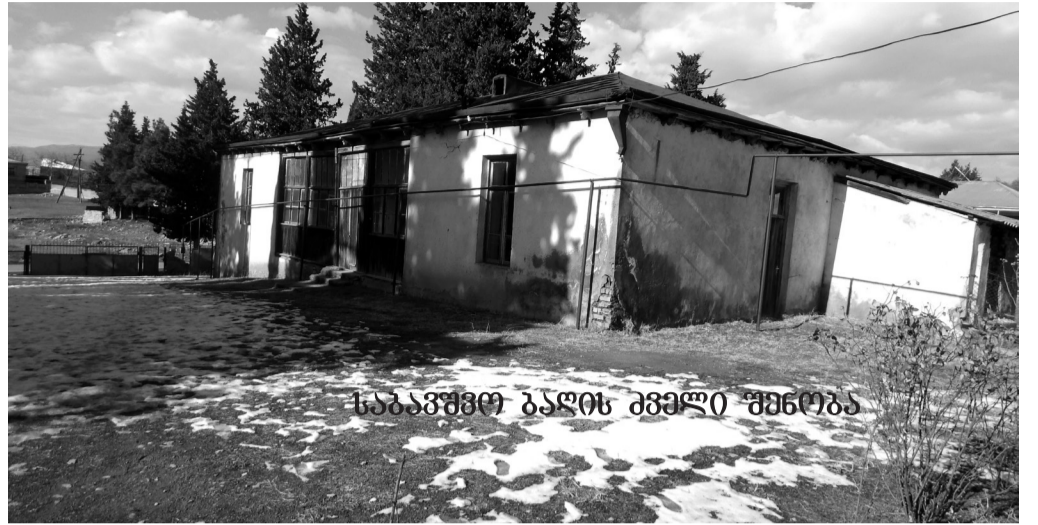
საბავშვო ბაღის ძველი შენობა

2018 წლის 29 მაისიდან დაინიშნა მერის წარმომადგენლად სოფელ დიდ ჩაილურში.