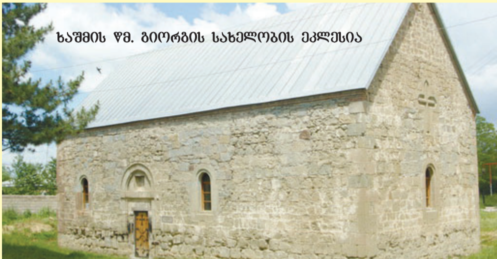
საშმის წმ. ბიორგობის სახელობის ეკლესია