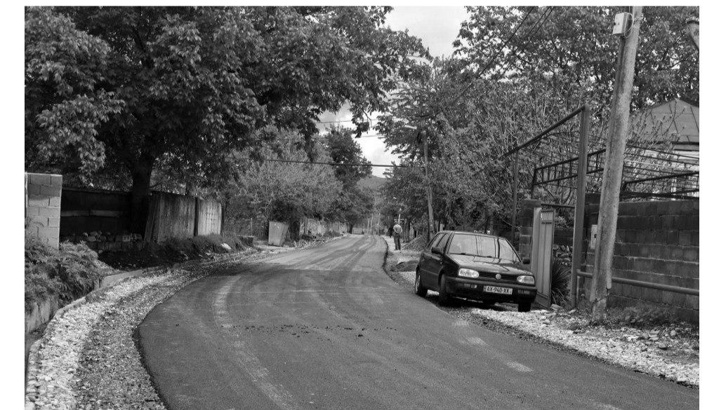
საგარეოს მუნიციპალიტეტის სოფელ უჯარმაში, მუხროვანსა და პაღლოში გარე განათების მონტაჟი და საგარეულამდე მისასვლელი გზის მოწესრიგება მიმდინარეობს.