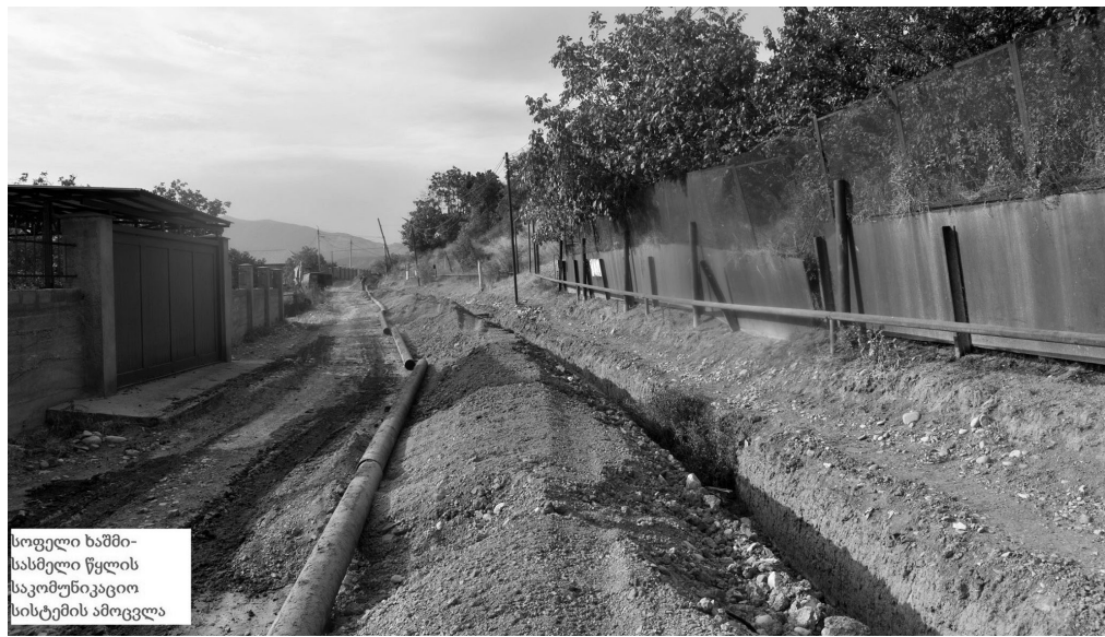
სოფელი ხაშში-სასმელი წყლის საკომუნიაკაციო სისტემის ამოცვლა

სოფელ ხაშში ცენტრალური გზიდან ე.წ. ტყისკენ მიმავალ ქუჩაზე, სადაც 35 ოჯახი ცხოვრობს, ასფალტი უნდა დაგეგმილიყო, მაგრამ აღმოჩნდა, რომ ამ ქუჩაზე გამავალი სასმელი წყლის ცენტრალურ ხაზამდე მიმავალი მილი 560-570 მეტრზე დაზიანებული იყო. აღნიშნული მილი სოფლის მთელ მოსახლეობას სასმელი წყლით ამარაგებს. ამიტომაც, ასფალტის საფარით ქუჩის დაფარვამდე ჯერ ეს მილები ამოიცივლა აღნიშნულ მანძილზე და მხოლოდ ამის შემდეგ გაგრძელდა ქუჩის კეთილმოწყობისათვის დაგეგმილი სამუშაოები.