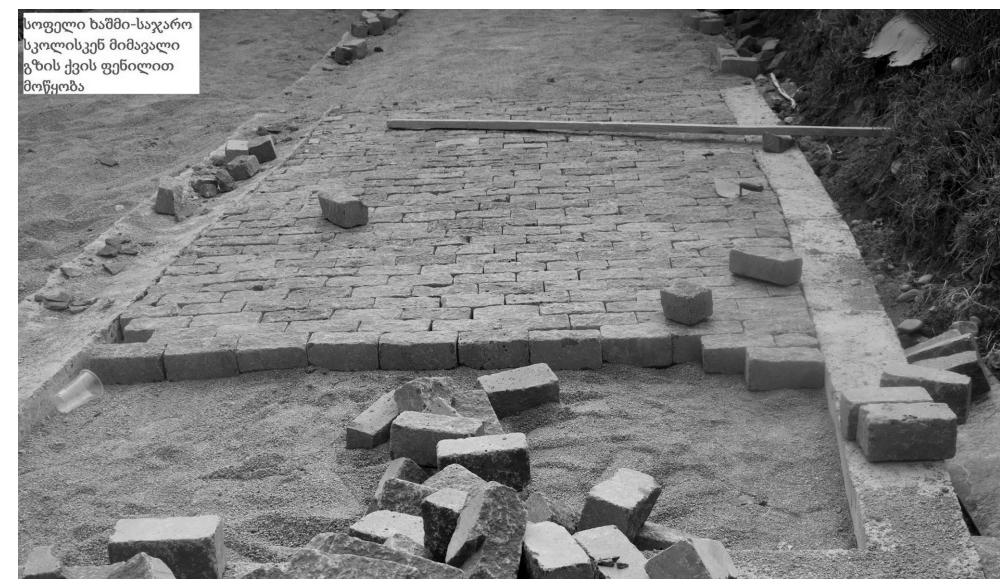
სოფელი ხაშში-საჯარო სკოლისკენ მიმავალი გზის ქვის ფენილით მოწყობა

სოფლის საჯარო სკოლის გზაზე 500 მეტრ მანძილზე დაიგო ქვაფენილი.