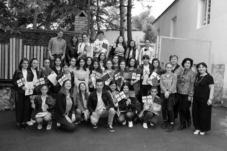
– ჩვენ საუბარში ამ სახლის კვლებში გაზრდილი ახალგაზრდები გავიხსენეთ, რომლებიც დღეს ცნობილი პიროვნებები არიან...

– გეტანხებით, ისინი უკვე შემდგარი, პროფესიონალი ადამიანები არიან. შეიძლება მე დღეს ვინმე გამომჩინეს, მაგრამ ვეცდები ყველა გავიხსენო.