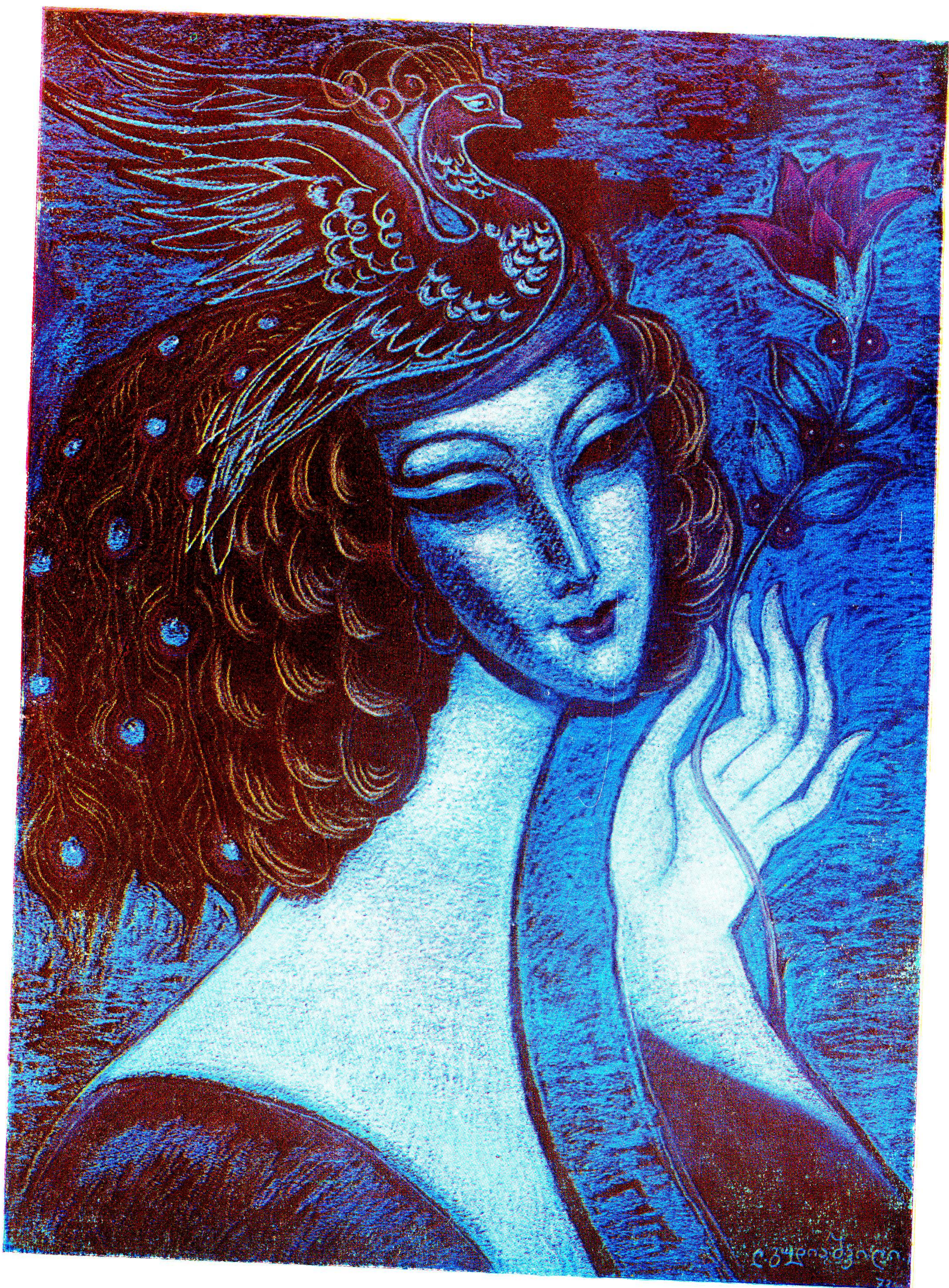
ბრმაზელი ნაზიბოღლუ, 1978 წელი, პასტელი.