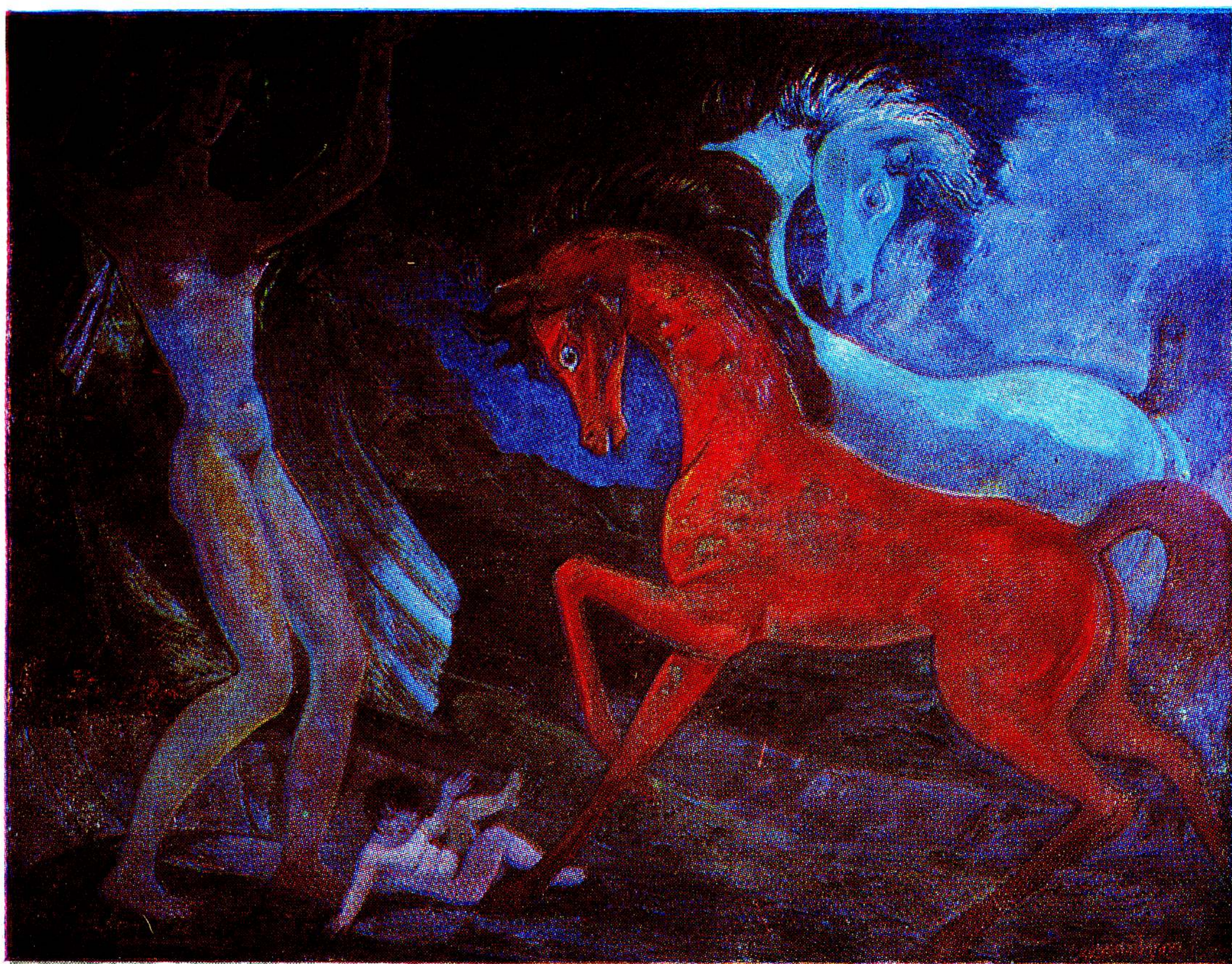
ზღაპარი წითელი რაზისა. 1960 წელი. ფერწერა.

ქ. შარვაშიძის ს. შ. ს. გ. შარვაშიძის სახ. მემკვიდრეობის მუზეუმი.