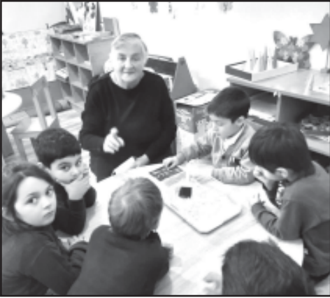
შრომლებისთვისაც საუკეთესო მეგობარია. ყოველთვის ვგრძნობთ მის თანადგომას...