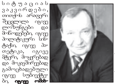
სიტუაცია ს ვაკვირდები, თითქოს არაფერი შეცვლილა იგივე ლოზუნგები და მონოდეზები იგივე პოლიტიკური სიტუაცია, იგივე პარტიკა, იგივე მტერი, მოყვრებად და მოკავშირებად გამოცხადებული იგივე სუბიექტები, იგივე ოპონიანი გაუმარჯოს!

30 წლის წინანდელ ამბებს რომ ვხსენებ და დღევანდელ