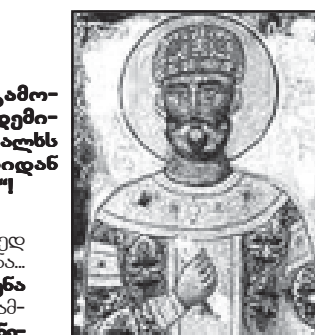
დავით IV დიდა, როგორც მთავარსარდალი იგი დიდგორის ომის შემოქმედია.

დავით IV დიდა თავისი ორგანიზატორული ნიჭით. ეს, პირველ ყოვლისა, გამოიხატა მუდმივი ქართული ჯარის შექმნით. მან 40 ათასი ყიფჩალი გადმოსახლა ჩრდილოეთ კავკასიიდან, რათა ქართული მუდმივი ჯარი გაძლიერებულიყო. იგი არა მარტო იბრძოდა, ქვეყნებს იპყრობდა, არამედ მან „დაამშვიდა ქვეყანა... განაწყო და აღაშენა ყოველი ოხერ-ქმნილი“. ამიტომ შეარქვეს „აღმაშენებელი“.