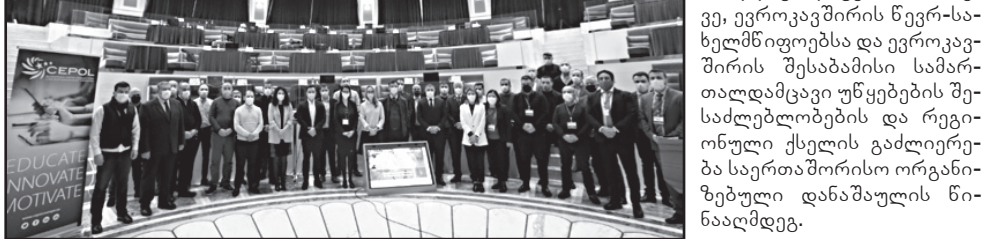
სწავლებაზე ექსპერტებმა განიხილეს ისეთი საკითხები, როგორცაა: არალეგალური შემოსავლის კონფისკაციის ხერხები; კრიმინალური გზით დაგროვებული ქონების ჩამორთმევისა და მართვის გზები; კრიმინალური გზით დაგროვებული ქონების მოძიება და კონფისკაცია; ევროკავშირის წევრი ქვეყნების გამოცდილება ფინანსური დანაშაულის გამოძიების კუთხით და სხვ.

უწყებათშორის ტრენინგს სამართალდამცველთა სწავლების ევროკავშირის სააგენტოს (CEPOL) მიერ მოწვეული ექსპერტები უძღვებოდნენ. ღონისძიებას ასევე ესწრებოდნენ ევროკავშირის დელეგაციის წარმომადგენლები.