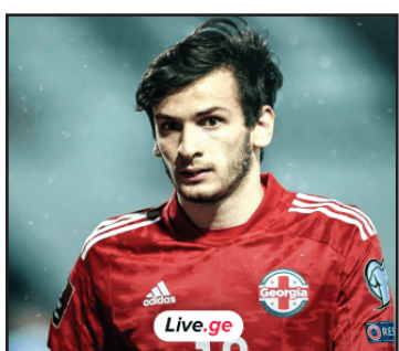
მოამზადა ბექა გოგინაშვილმა

ხვიამ კვარაცხელიამ ერთ-ერთი ამხანაგური მატჩის დროს ტრავმა მიიღო და მისი მდგომარეობის შესახებ რუბინის მთავარმა მწვრთნელმა ლიონიდ სლუსკიმ ისაუბრა, რომელმაც თქვა, რომ კვარაცხელიას ტრავმა სერიოზული არ არის: