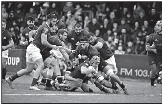
ნიგრადაში - 23:6. საქართველოს რუსეთისთვის გატანილი ბურთები 70 ლელო (მიიღო 17) და 618 ქულა (273 გაშვებული).

შეხვედრა 2023 წლის მსოფლიო თასის შესარჩევი ეტაპის ეგიდით ტარდება და გამარჯვების შემთხვევაში, „ბორჯღალოსნებს“ საფრანგეთის საგზური დაბეჭდული ექნებათ, მაგრამ დარჩენილ თამაშებში პირველი ადგილისთვის ბრძოლას გააგრძელებენ.