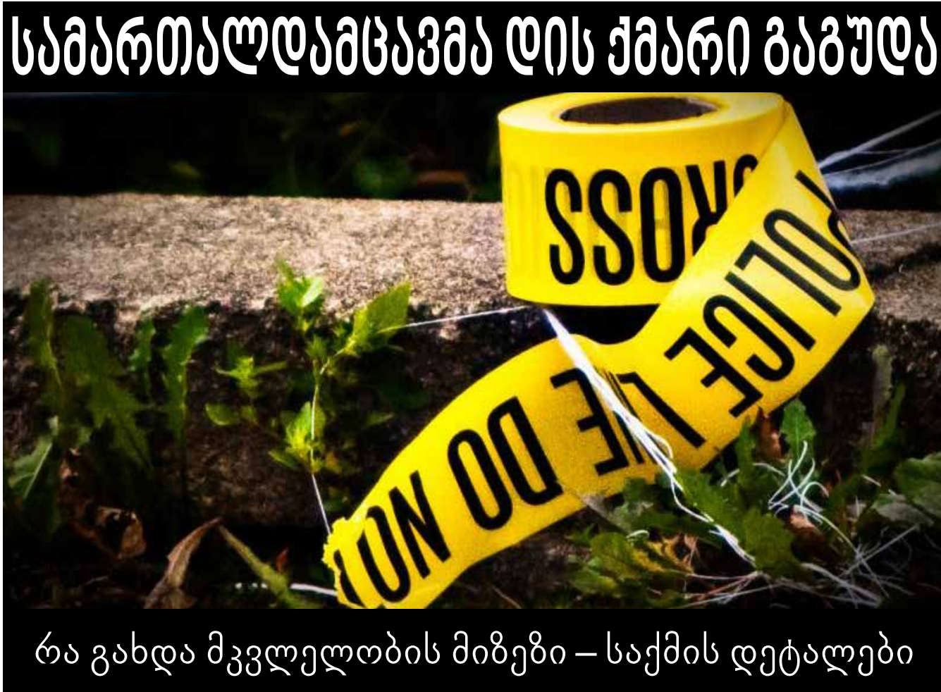
რა გახდა მკვლელის მიზეზი – საქმის დეტალები

სამუშაოდ, დღეს იარაღის უკანონოდ შეძენა რთული არ არის. მით უმეტეს, ახლა, როცა უკრაინაში ომი მძვინვარებს... მშვიდობიანობის დროს, უკანონო იარაღი რისთვის გამოიყენება, კარგად მოგეხსენებათ. არადა, ამ კონკრეტულ შემთხვევაში, საუბარი არაა უბრალოდ პისტოლეტზე, ადამიანები ავტომატებს, ნაღმტყორცნებსა და ტანკის ნაწილებსაც კი ასაწყობებენ. ადრე, იარაღის ხელში ჩაგდება ურთულესი საქმე იყო და ამისთვის კრიმინალები ან ქუჩაში ესხმოდნენ თავს სამართალდამცავებს, ან სამხედრო ნაწილებზე მიჰქონდათ იერიში. იყვნენ ისეთებიც, რომლებიც იარაღს მამინ შოულობდნენ, როცა სამართალდამცავები დამნაშავეთა ჯგუფს აკავებდნენ. ამოღებული არსენალიდან რაღაც ქრებოდა და ეს მანამ, სანამ აღწერა ჩატარდებოდა, შემდეგ იარაღი ხელიდან ხელში გადადიოდა და... ჰო, პარადოქსია, როცა სამართალდამცავები ამოღებულ იარაღს ისევ კრიმინალებს უბრუნებდნენ და ეს ძალიან იშვიათად ხდებოდა, მაგრამ... ხდებოდა.