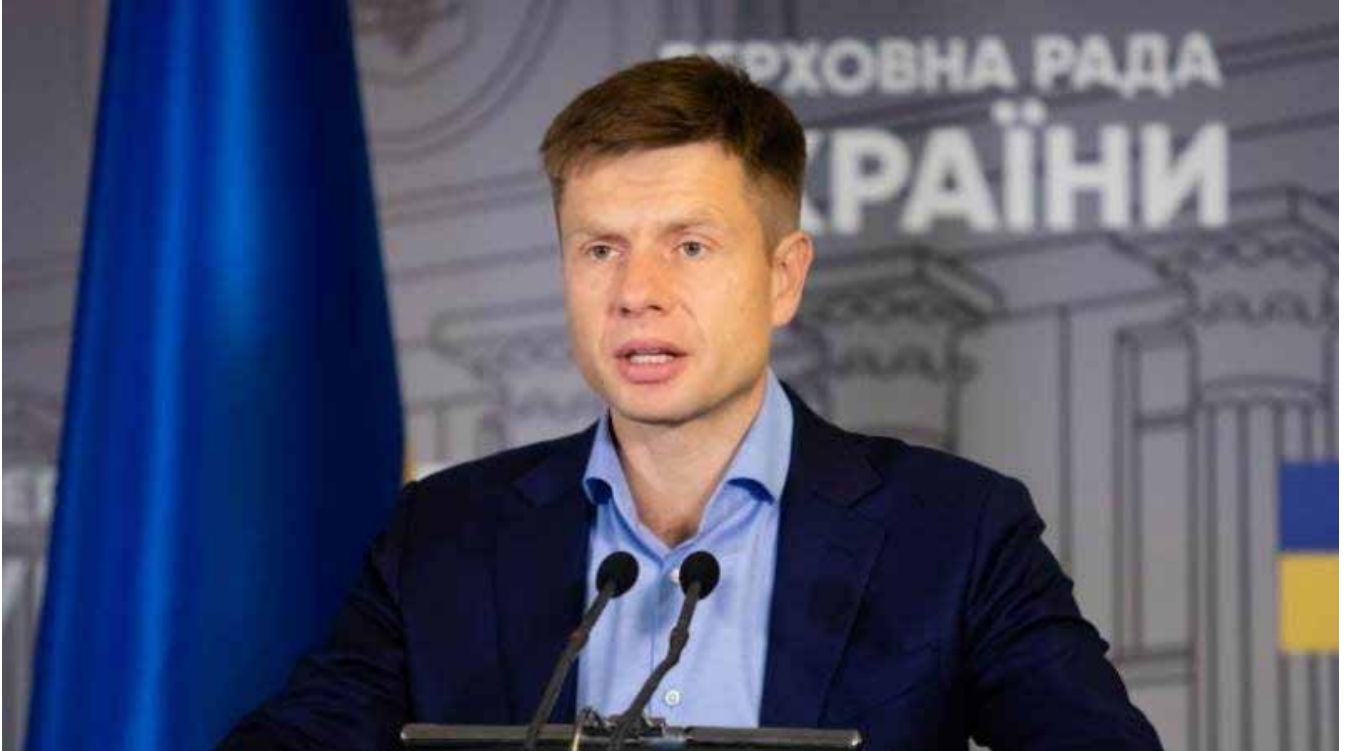
ვლოდიმირ ზელენსკიმ საქართველოში უკრაინის ელჩი გაიწვია

უკრაინელი პოლიტიკოსია, უკრაინის უმაღლესი „რადას“ მერვე და მეცხრე მოწვევის დეპუტატი, ევროპული სოლიდარობის ფრაქციის წევრი. 2010 წლიდან, მეექვსე