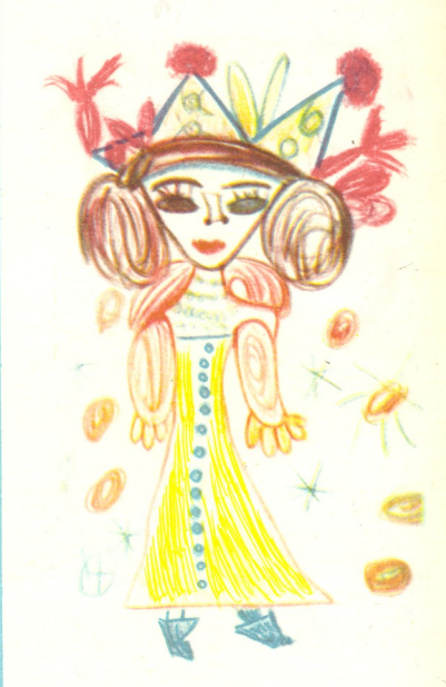
"ფერია" --- ნახატი საიდა ტყვარჩელი. zadabadoba,