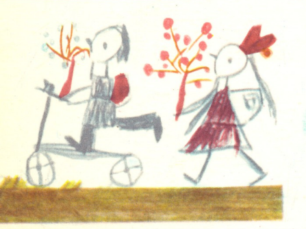
"გასეირნება" — ნახატი ნინო ჩხაიძისა, 5 წ. თბილისი.