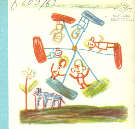
"კარუსელი" — ნახატი ნანა ხორნაულისა, 5 წ. თბილისი.