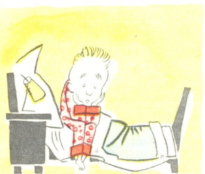
4. რა ჰქნას? ძალ-ღონეს იკრებს, ბიჭი მიეცა ფიქრებს.