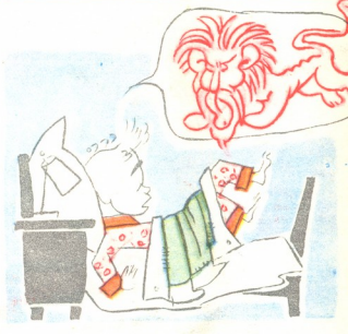
3. უეცრად მოჰყვა ღრიალს. ძილში ლომს ებრძვის გია.