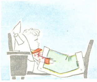
2. ძილში ეძახის დედას, რა სიჭმარს ხედავს, ნეტავ?!