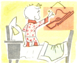
5. გადაიწმინდა ოფლი, დახატა დიდი თოფი.