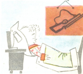
6. აღარ ეძახის დედას, რა მშვიდად ძინავს, ხედავთ?!