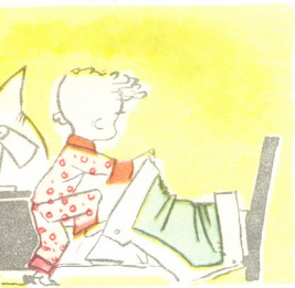
1. პატარა ბიჭი გია ლოგინში ჩაწვა გვიან.

კიდევ დაიზრდებიან წიწილები მალეო, მათაც შევებრამუნებ,— დიელი დალაღალეო.