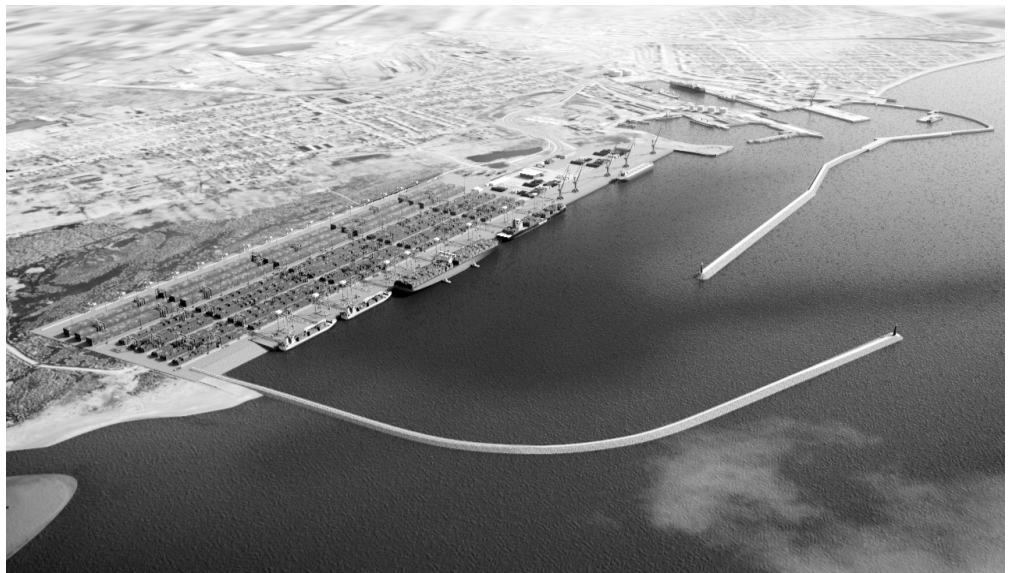
ფოთის პორტის სანაპირო

შეიხიდა საქართველო- ში ყველაზე დიდი პორ- ტი - „ფოთის საზღვაო ნავსადგური“ რომელ- საც მრავალმიზნობრი- ვი დანიშნულება აქვს. ნავსადგურში სულ 15 ნავმისადგომია, სადაც ხდება ყველანაირი სატ- ვირო მომსახურების, მათ შორის რო-რო სერ- ვისის განხორციელება. ნავმისადგომების მთლი- ანი სიგრძე შეადგენს 2,900 მეტრს, სადაც 20- ზე მეტი საპორტო ამწვა განლაგებული. სათავეში მოსვლის დღიდან, „ეიპი- ემ ტერმინალსმა“ უზრუნ- ველყო 70 მილიონ აშშ დოლარზე მეტი ინვეს- ტიციის განხორციელება ინფრასტრუქტურის, საბა- ზო ცენტრის, სარკინიგზო და საავტომობილო გზე- ბის და სერვისის გა- ნახლების მიზნით.