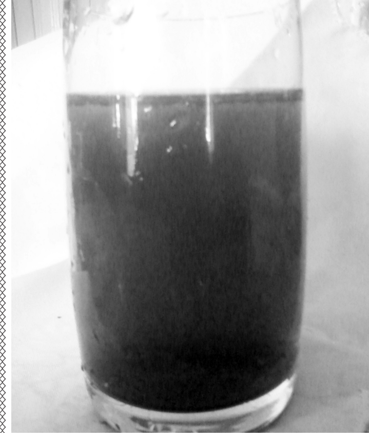
დაბინძურებული წყალი ქიანში

გურამი: „ფულის გადახდის დაგვიანებას არავინ გაპატიებს. არადა, ისეთი დაბინძურებული წყალი მოდის, დასაღწევად არ ვარგა და ზოგჯერ არც ოჯახში სახმარად. მოდინ სინჯებს იღებენ, ქლორსაც ვუკეთებთო, ამობენ მაგრამ რა ეტყობა? არც მომსახურება აქვთ წესიერი, წყლის აღწერაზე რომ დადის ის ქალი, ხან მოვა ხან არა, ზერეფედ ჩაწერს და მერე ხან 2 ლარი მოდის თვეში ხან 30, შეიძლება ასე? ჩემი სახელი არ ჩაწერო, იმ ქალის გადაკიდება არ მინდა“.