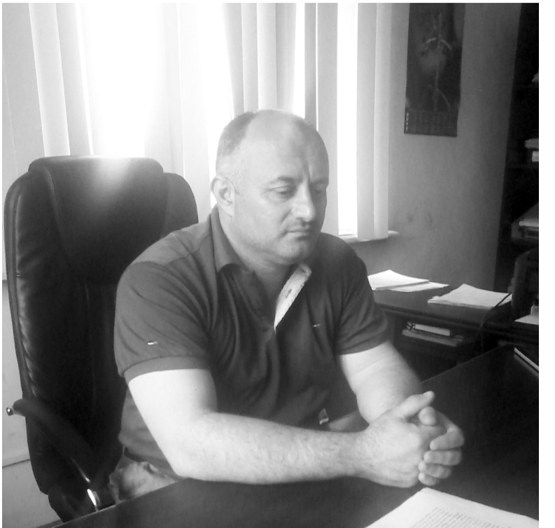
სობის წყალკანალის უფროსი

წყალი არ გადის? დამაყარეს კითხვები და გაურკვეველი შემადგენლობის სითხის დათვალიერება განაგრძეს. ისიც გაუკვირდათ, მრიცხველის ფილტრმა როგორ გაატარა ასეთი სიბინძურე. საუბედუროდ, აუცილებლად უნდა აღინიშნოს, რომ ხსენებული „ფილტრი“ უკვე აღარაფერს უყენია, რადგან ფილტრი წყალს არ ატარებდა და მოსახლეობამ ჯერ კიდევ მრიცხველის დაღუპვამდე მოხსნა. „მრიცხველის ფილტრი იწმინდება და ისევ უნდა დაყენდეს“- „დამარიგა“ ბატონმა ხეიჩამ, მაგრამ სამწუხაროდ, ის ფილტრი შემდეგი მოხმარებისათვის უვარგისია. თუმცა, ფილტრმა ეს სიბინძურე რომც არ გაატაროს, წყალი ხომ უკვე დაბინძურებულია და მისი მოხმარება მაინც დაუშვებელია? დიახაც რომ, ამ სითხეს არ შეიძლება წყალი ეწოდოს, მაგრამ სწორედ ასეთი „წყალი“ მოდის ჩემს და არა მარტო ჩემს ონკანში, თან ძალიან ხშირად. „ეს წყალი არათუ დასალევად, ტექნიკურადაც არ ვარგა. მე დავერკავ ლაბორატორიაში და გავარკვიე, როდის აიღეს პირველ ხორგაში წყალი. ვიცი, რომ იქ ქლორიდები დასაშვებ ზღვარზე ცოტათი მეტად არის აწეული, მაგრამ ეს უკვე ტალახია. მალე ხორგაც ხობს დაუერთდება და სიტუაცია რადიკალურად შეიცვლება. როდესაც 24 სთ არ არის წყალი, მილი რაც უნდა კარგ მდგომარეობაში იყოს, თან იქ თუჯის მილებია, ხინჯი მაინც წამოყვება. ყველა ქვითარს უკანა მხარეს აწერია ცხე-