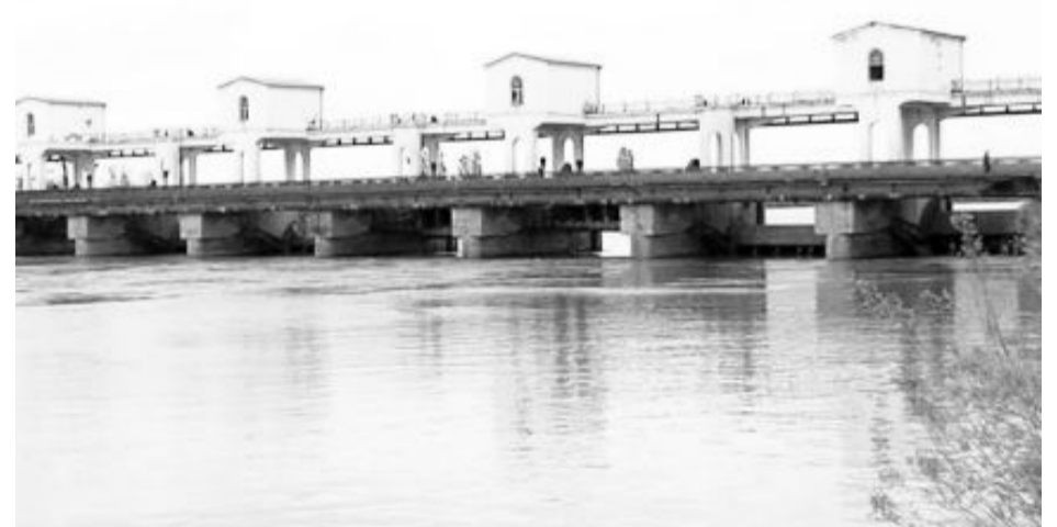
ფოთში მე-7 კილომეტრზე არსებული ხილი