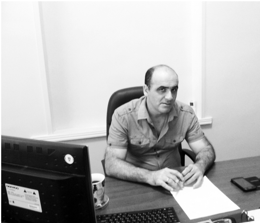
ფოთის რესურსცენტრის უფროსი

მამიშვილები სწავლობს იმავე სკოლაში. მეორე საფეხელთა იყო, ყველას შეეძლო დარეგისტრირებულიყო ონლაინ რეჟიმში. მესამე ეტაპი ასეთია - თუ პირველ და მეორე ეტაპზე დარეგისტრირებულებმა სკოლაში დროულად არ წარადგინეს ჩასარიცხი საჭირო დოკუმენტაციები, გაუქმდება. გამოცხადდება ისევ ვაკანსია და, შესაბამისად, მესამე რეგისტრაცია 22 ივნისიდან დაიწყება. პირველი რეგისტრაციის შედეგად სკოლები თითქმის შევსებულია. რაც შეეხება სასკოლო ასაკს, ასაკთან დაკავშირებით არაფერი შეცვლილა. ზოგადი განათლების სწავლის დაწყების