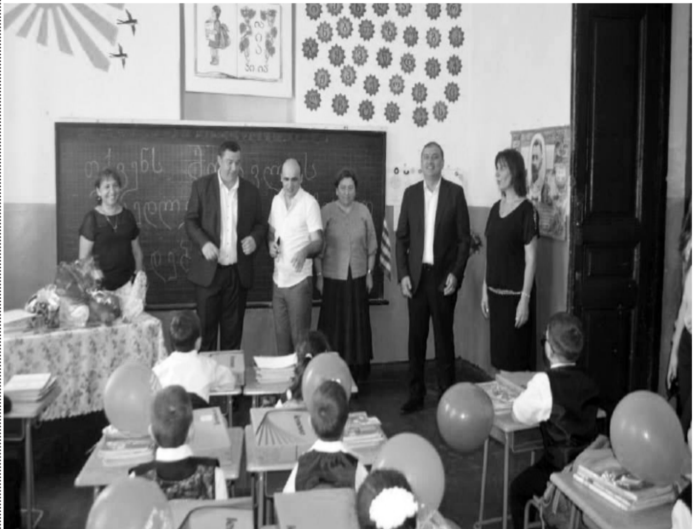
ქათი ჟითაჟა ფოტოთი

დღეს ფოტოთის ყველა საჯარო სკოლაში სასწავლო წელი დაიწყო. ახალი სასწავლო წელი ყველგან საზემო ვითარებაში დაიწყო. ზემში მონაწილეობა ადგილობრივმა მთავრობამაც მიიღო. ფოტოთის მერმა ირაკლი კაკულიამ, საკრებულოს თავმჯდომარემ ალექსანდრე თოფურიამ და რესურსცენტრის დირექტორმა გონა ქორქიამ სწავლის დაწყება რამდენიმე სკოლას თავად მიულოცეს. ფოტოთში სულ 11 საჯარო და 3 კერძო სკოლაა. წელს ფოტოთის საჯარო სკოლაში 480 პირველკლასელი მივიდა. განათლების სამინისტრომ წელსაც ტრადიცია არ დაარღვია და 480-ზე პირველ კლასელს განახლებული პორტაბელური კომპიუტერი - ბუკი საჩუქრად გადასცა. წელს პირველკლასელთა რეგისტრაცია სამ ეტაპად მიმდინარეობდა. მათთვის, ვინც გარკვეული მიზეზების გამო, ვერ მოახერხა რეგისტრაციის დროულად გაველა,