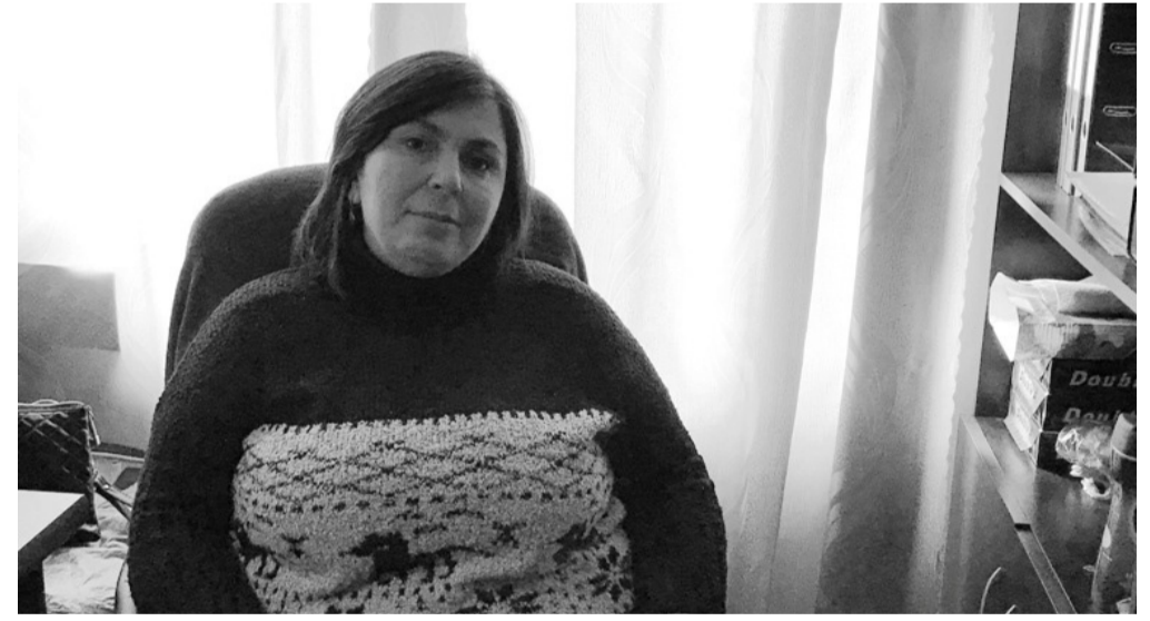
კმაყოფილებას? გვაძლევს უფრო მეტ მიზეზს კმაყოფილებისთვის“. რას ურჩევთ ქალბატონებს? - „ყოველი დღე დაიწყო პოზიტიური განწყობით, იყვნენ უფლის მადლიერნი და სიყვარულით აკეთონ ოჯახური თუ საზოგადოებრივი საქმე“.

ეკას, და არამარტო მას, „მინ მოვლის“ ექიმებსაც პირადი ხარჯებით შეუძენიათ ბენეფიციარებისთვის წამლები და საკვებიც. ხშირად თბილი კერძიც მიუტანით მათთვის. როგორც თვითონ ამბობს, ჰყავს არაჩვეულებრივი მეუღლე, რომელიც გვერდში უდგას ყოველმხრივ: „მეუღლე მუდამ ხელს მიწყობს, რომ ჩემი საყვარელი საქმე ვაკეთო“. საყვარელი საქმე კი, როგორც გვეუბნება, თავისი პროფესია და მასთან დაკავშირებული რამეა. მისი ოცნებაა თბილი კომპორტული მოხუცთა სახლი, რომელსაც თავად შექმნის დიდი რუდუნებით. შეიქმნება სახლი, სადაც ოჯახური სითბო, კომფორტი და სიყვარული იქნება უპირატესი. ყველაზე მარტივი რეცეპტი წარმატების მოსაპოვებლად - „სამყაროში ყველაზე მთავარი სიყვარული და მადლიერების გრძნობაა. მადლიერების გარეშე არანაირი წარმატება არ არსებობს. ქრისტიანობაც გვასწავლის: იყავი მადლიერი, თხოვე პატივს და აპატიე. გვინდა თუ არა, გვჯერა თუ არა, მაინც ყოველ წუთს ვწუთ ჩვენი ცხოვრების სცენარს ჩვენი ფიქრებით. ადამიანი თუ ნეგატივიზმა, თუ ვერ პატივს, თუ საკუთარი თავის და სამყაროს უკმაყოფილოა, რას შეიძლება ელოდოს მომავლისგან? ცხადია, ის თავის ცხოვრების გზაზე უკმაყოფილო ადამიანებს მოიხიდავს, რომლებიც მუდმივად შეახსენებენ, რომ ცხოვრება საშინელებაა, თავად კი უიღბლო. გარეგანი ასახავს შინაგანს, სამყარო გვირეკლავს და იმას გვაძლევს, რასაც გავცემთ. გავცემთ სიყვარულს? დაგვიბრუნებს სიყვარულს, გავცემთ