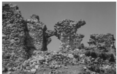
„არს მთის კალთას, სკანდას, სასახლე მეფეთა და ციხე დიდი, დიდშენი“ მასშუბტი ბაბრატონი