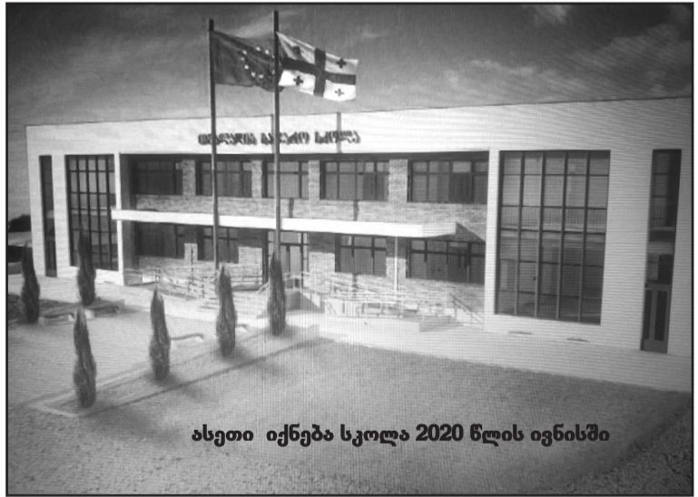
ასეთი იქნება სკოლა 2020 წლის ივნისში

სამუშაოები წინ მიიწევენ, ბრიგადები ერთმანეთს ჩაენაცვლებიან, იმის მიხედვით, რა სამუშაოები იქნება შესასრულებელი, სპეციალისტებიც ამ წესით იქნებიან ჩართულნი სამუშაოებში.