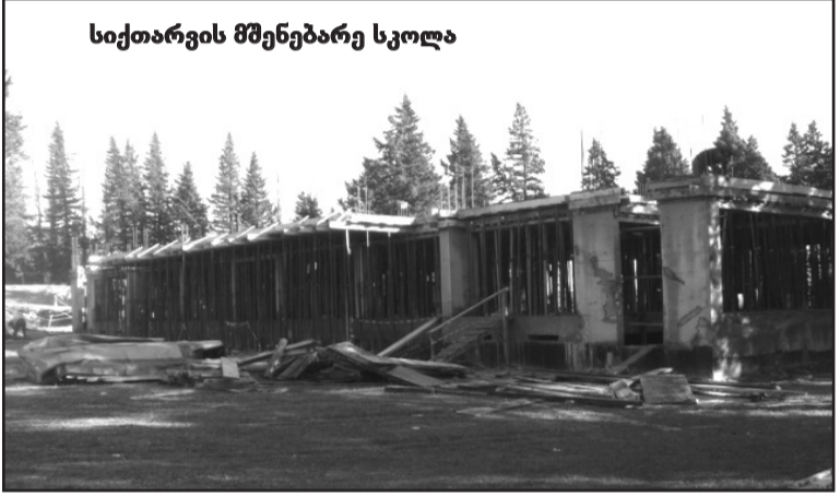
სიქთარვის მშენებარე სკოლა

შვიდწლიანი სკოლის ხის შენობა ვეღარ აკმაყოფილებდა მოთხოვნებს, მოგვიანებით საშუალო სკოლა გაიხსნა და ახალი კაპიტალური შენობა აიგო, ამასობაში 21 საუკუნე დადგა, დღის წესრიგში კი დადგა ახალი სკოლის მშენებლობის საკითხი—საკითხის დადებითად გადაწყვეტას დიდი ძალისხმევა დასჭირდა, (მათზე, ვინც განსაკუთრებული წვლილი შეიტანა სკოლის მშენებლობის დაწყების საქმეში, ცალკე გვექვება საუბარი) 2019 წლის ივნისში