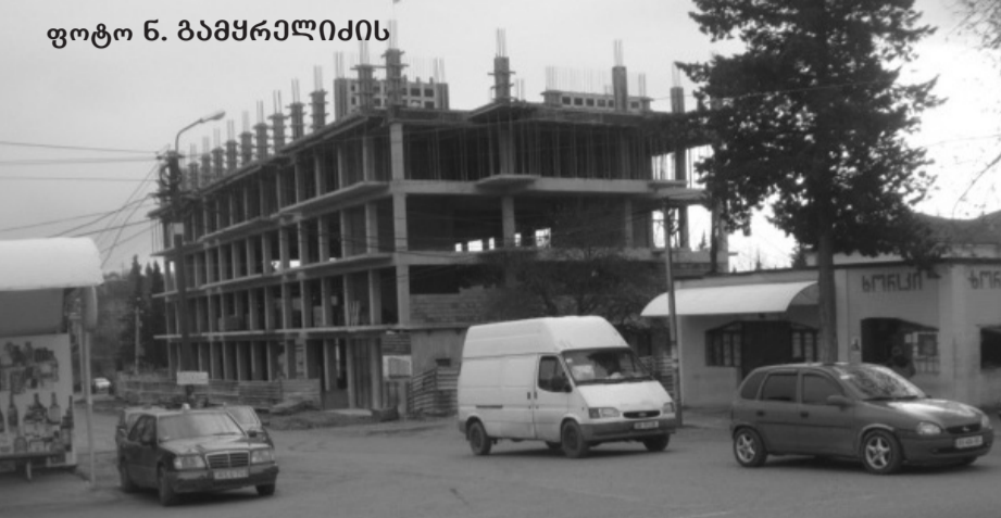
საცხოვრებელი კორპუსის მშენებლობა ჩვენს ქალაქში