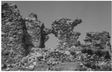
„არს მისი კალთას, სკანდას, სასახლე მუყუთა და ცხე დიდი, დიდუნა“ ვახუშტი ბაბრათიონი