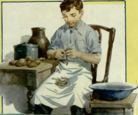
„ირუნავს, უფროსებს ვხმარებთ.“