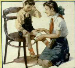
„მეაჩხერა კარგია ამხანაგადა, უტყროსივებსე“