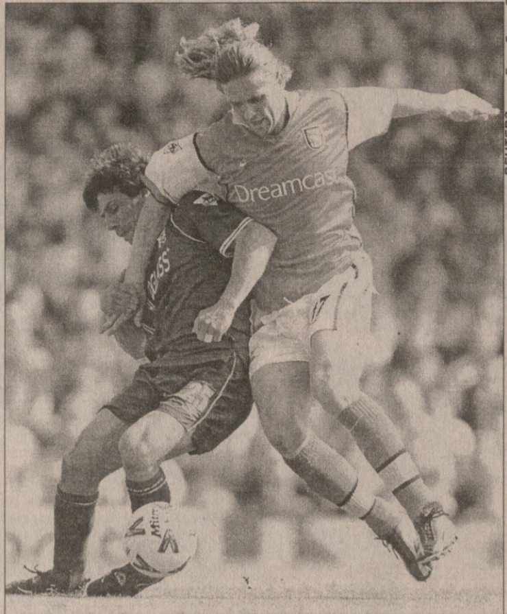
არსენალი — ჩელსი 2:1. ემანუელ პეტემ (მარცხნივ) და მისმა გუნდმა ჩანფრანკო ძოლა და „ჩელსი“ დაჩაგრეს