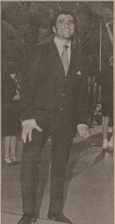
ლა ბომბა: ალბერტო ტომბა