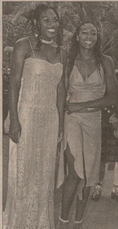
იელოვას დები: სერენა და ვინუს უილიამსები