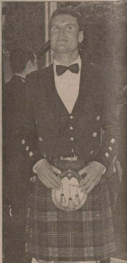
აი, შოტლანდიელი: დევიდ კულპარდი

სარბიელი სპორტული გაზეთი გამომცემი 1990 წლის 28 დეკემბერიდან გამომდის სამშაბათს, ოთხშაბათს, ხუთშაბათს, პარასკეპს და შაბათს