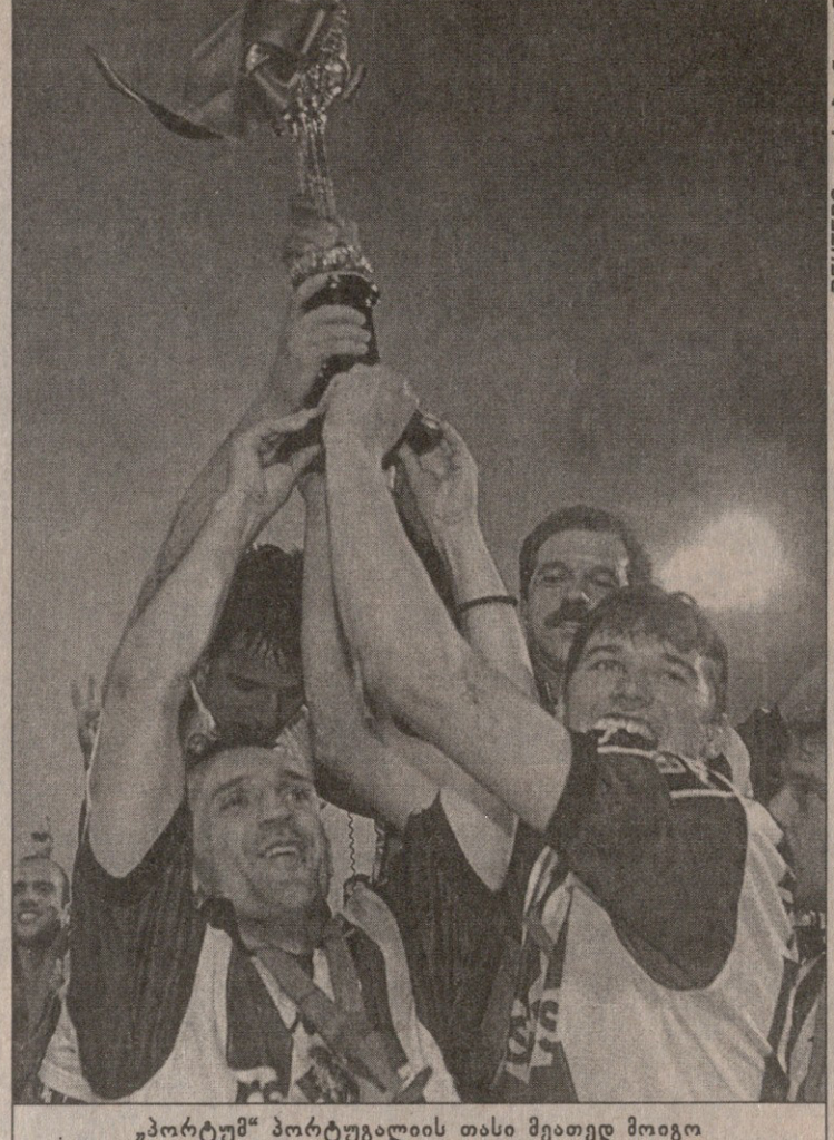
„პორტუ“ პორტუგალიის თასი მეთედ მოიგო