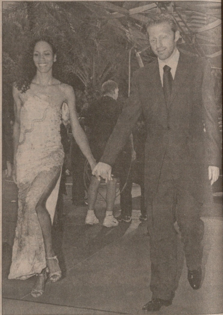
ბორის ბეკერი მონტე კარლოს მეუღლე ბარბარასთან ერთად ეწევი

ლომბოლი ლენს არმსტრონგი. წლის მძლეოსანი უუნაროთა შორის — ინგლისის ეტლით მრბოლი, ავსტრალიელი ლუის სუვიჯი. წლის ალტერნატივა — ამერიკელი შოსენ პალმერი, რომელიც მრავალ სახეობაში ცდის ბედს. კარიერისთვის საუკუნო ჯილდო დამსახურა პელემ. თუმცა, ფეხბურთის მეფე რომში იყო ახლოაღმოსავლეთში მშვიდობის დარეგულირებისადმი მიძღვნილ საფეხბურთო მატჩზე, სადაც იასერ არაფატსა და შონ კონერის ებასებოდა და მონაკოში ვერ ჩამოასწრო. მის ღირსებებზე ნელსონ მანდელამ იბაასა. გამარჯვებულნი დაასახელა მსოფლიო სპორტის აკადემიამ, რომელსაც ხელთ ჰქონდა უუნარლისტავან შედგენილი ორასკაციანი სია.