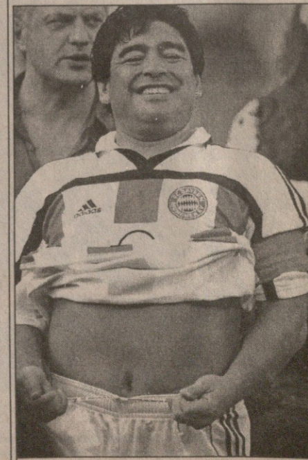
დიეგო მარადონა: ჩემი ღიბის ცხონებამ...