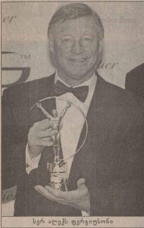
სერ ალექს ფერგიუსონი