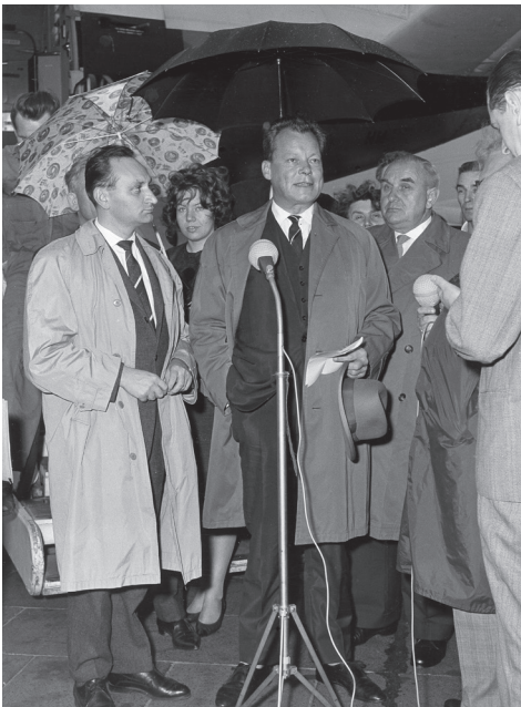
4. აშშ-ში მოგზაურობიდან დაბრუნებისას ტემპელჰოფის აეროპორტში.