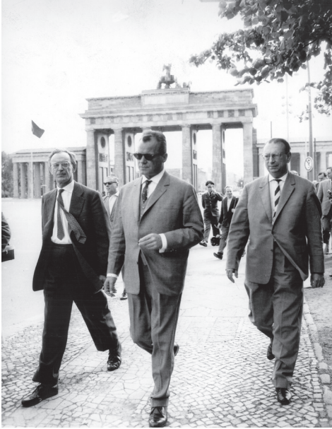
3. ბრანდენბურგის კარიბჭესთან სენატის კანცელარიის შეფთან ჰაინრიხ ალბერტცთან (მარჯვნივ) ერთად.