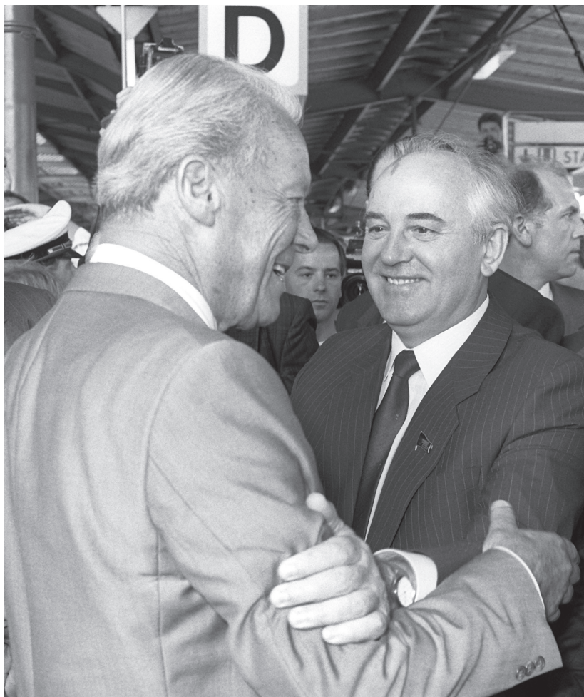
19. ახალი იმედების მოლოდინში: ბრანდტი და გორბაჩოვი ბონში 1989 წელს.