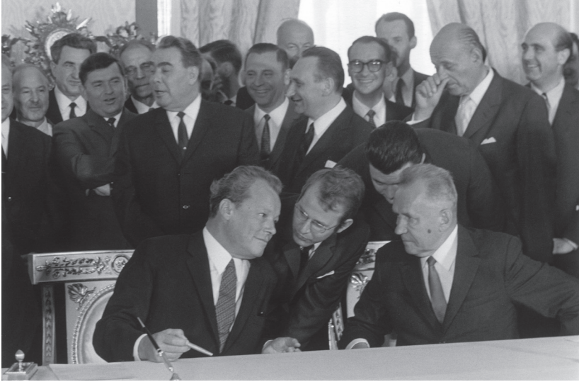
9. მოსკოვის ხელშეკრულების ხელმოწერის წინ კრემლში 1970 წლის 12 აგვისტოს. სანამ ბრანდტი და კოსიგინი რაღაცას არკვევენ, უკანა რიგებში უკვე მხიარულობენ.