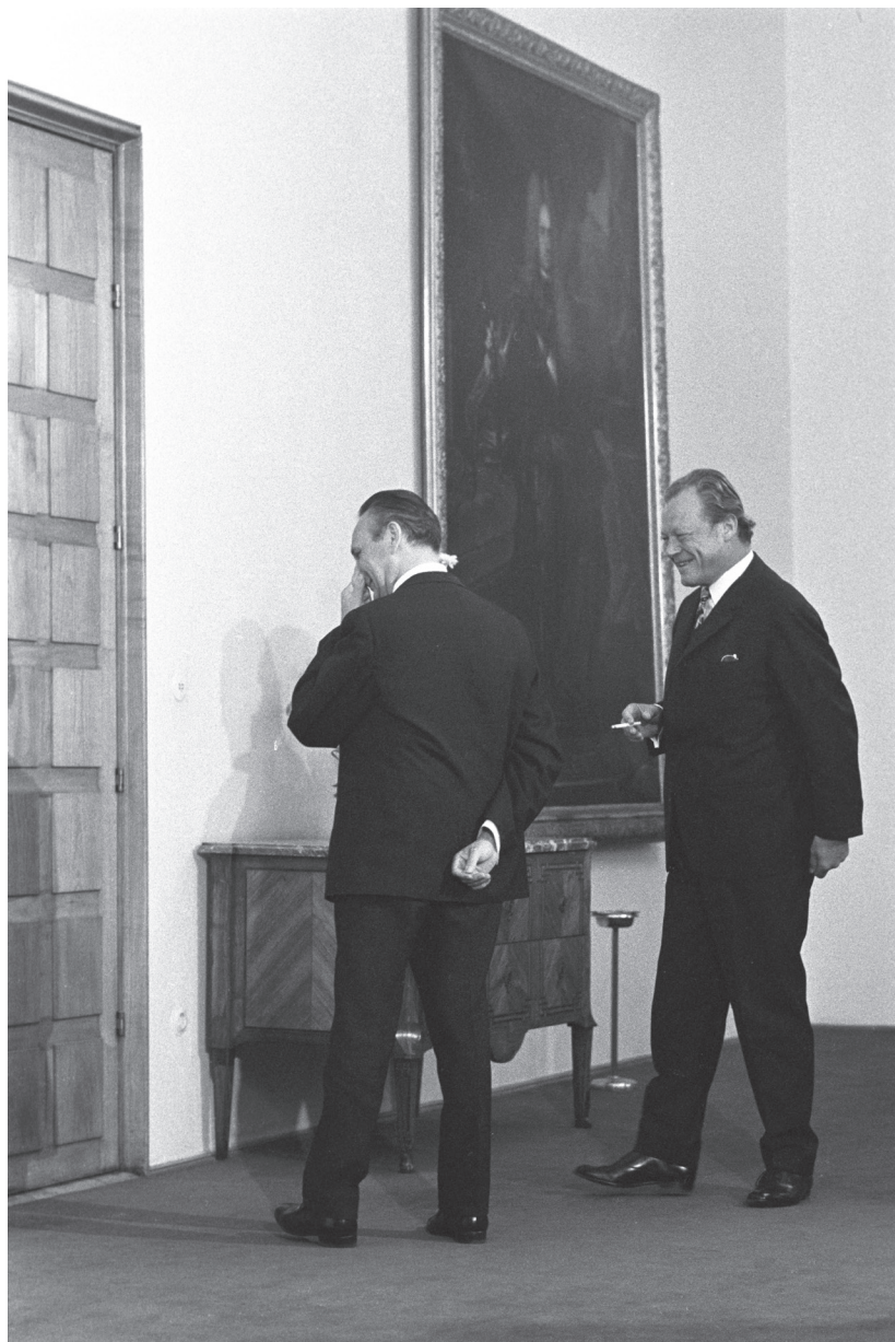
7. ხუმრობისთვის კანცლერის აპარატში დრო იშვიათად გვაქვს, მაგრამ თუკი სტუმარი იგვიანებს...