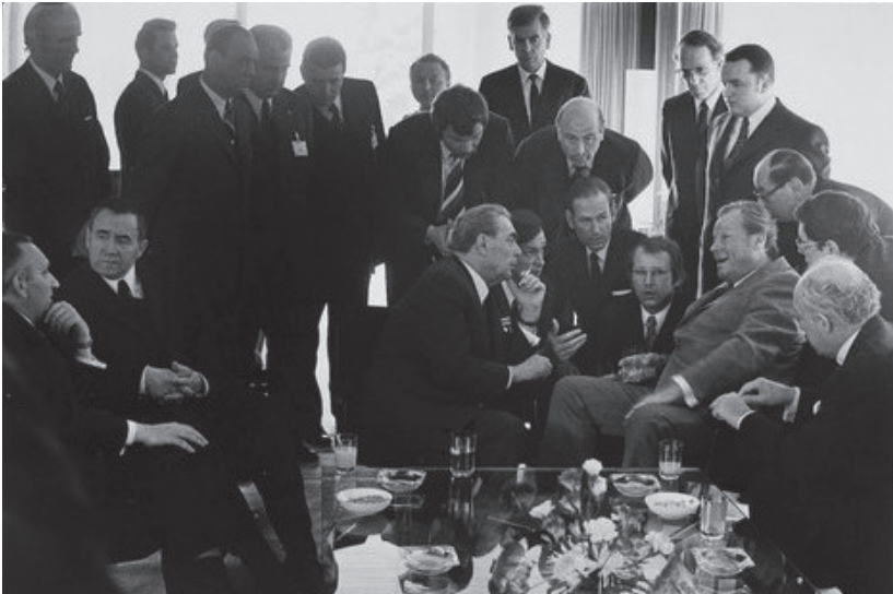
14. მარჯვნივ შეფები სხედან, მარცხნივ მომლაპარაკებლები, რომელთაც თარჯიმანი არ სჭირდებათ. ბრეჟნევი და გრომიკო 1973 წლის მაისში ბონში, პეტერსბერგზე.