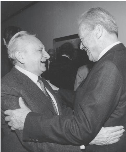
18. მეგობარი მილოცავს 70 წლის იუბილეს 1992 წელს.