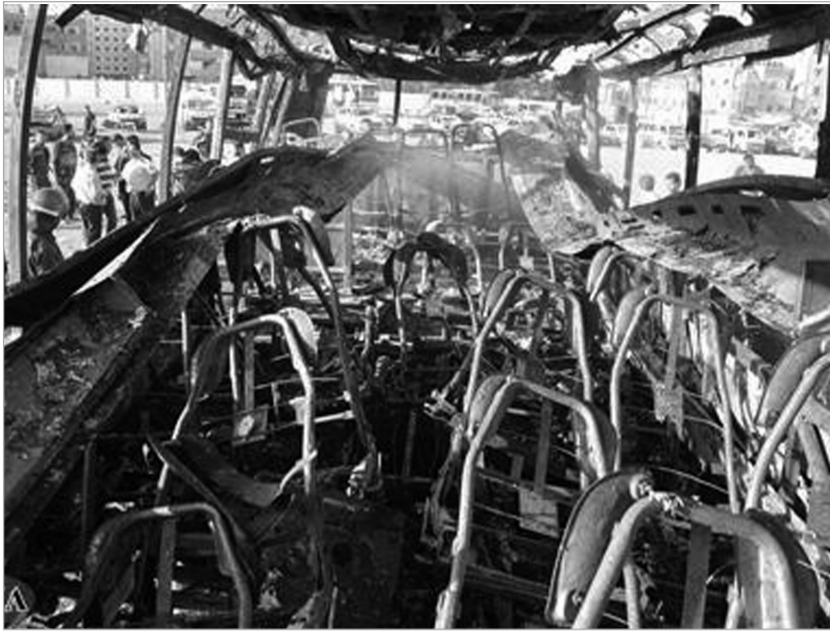
დამასკოში აფეთქებული ავტობუსი

სირიის გამო სულ უფრო გამწვავდა ურთიერთობები ამერიკის შეერთებულ შტატებსა და რუსეთს შორის. ერთმანეთის მიმართ ბრალდებებიც გაიზარდა, რაც ექსპერტებს ორი ქვეყნის ურთიერთობებში სერიოზული კრიზისის მორიგ ტალღაზე მიანიშნებს. რუსი ექსპერტები მიიჩნევენ, რომ ოფიციალური მოსკოვი ლიბიის მაგალითის გათვალისწინებით ვაშინგტონთან დათმობებზე აღარ ნავა და მხარს სამხედრო ინტერვენციას არ დაუჭერს. "საკითხი პრინციპულად დგას. მას შემდეგ, რაც კრემლმა მიიჩნია, რომ იგი ლიბიის ომის დროს გააცურეს და სანქციებზე დაითანხმეს, ამ ანკეს მოსკოვი აღარ ნამოეგება. კომპრომისი ამერიკის შეერთებულ შტატებთან ნაკლებად სავარაუდოა. პრეზიდენტის პოსტზე კვლავ პუტინის მოსვლის შემდეგ ამერიკულ-რუსული ურთიერთობები გაუარესდება. ყველაფერი ობამა-პუტინის შეხვედრის შემდეგ გაირკვევა", - აცხადებს მოსკოვის საერთაშორისო ურთიერთობების სახელმწიფო ინსტიტუტის პროფესორი სერგეი ოზნობიშვილი. თუ ზოგიერთი პოლიტოლოგი მორიგების შანსებს სირიის კონფლიქტის დასრულების გზებზე 50/50-ზე აფასებს, არიან ისეთებიც, ვინც კომპრომისს საერთოდ გამოირიცხებს და შექმნილ მდგომარეობას ჩიხს უწოდებს. რუსეთი ამერიკის შეერთებული შტატების სახელმწიფო მდივნის ჰილარი კლინტონის ბრალდებებს უარყოფს და აცხადებს, რომ იგი სირიას სამხედრო ვერტმფრენებს არ აწვდის, სამაგიეროდ, თავად ვაშინგტონი ამარაგებს სპარსეთის ყურის ქვეყნებს იარაღით, მათ შორის არსენალს არც სირიელი ამბოხებულებისთვის იშურებს. რუსეთის საგარეო საქმეთა