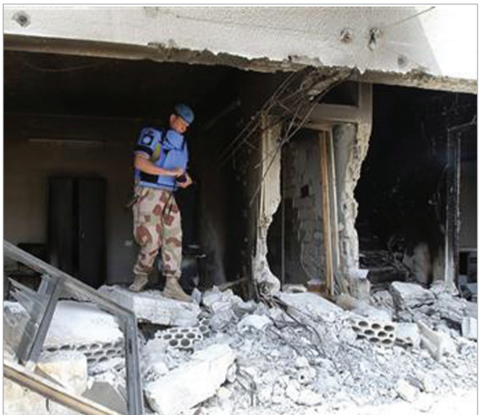
გაეროს დამკვირვებელი ლატაკიაში