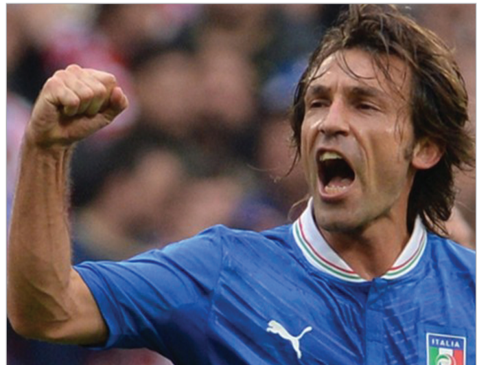
ანდრეა პირლომ იტალია დაანინაურა