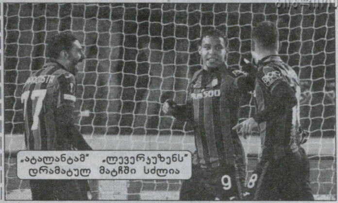
„ატალანტამ“ „ტუვერკუზენს“ დრამატულ მატჩში სძლია

გოლი: ჩალობა 3 (0:1), მაუნტი 14 (0:2), პუკი 69 პენ. (1:2), პავერცი 90 (1:3) ნოვიჩი: კრული, აარონსი, ზიმერმანი (46. რუპი), პენლი, კაბაკი, უილიამსი, ლეს მელიუ, ნორმანი (46. რაშიკა), მაკლინი, სერგენტი (83. როუ), პუკი ჩელსი: მენდი, ჩალობა, ტიაგო სილვა, კრისტენსენი, საულ ნიგესი, უორტონი, კოვამიჩი (86. კანტე),