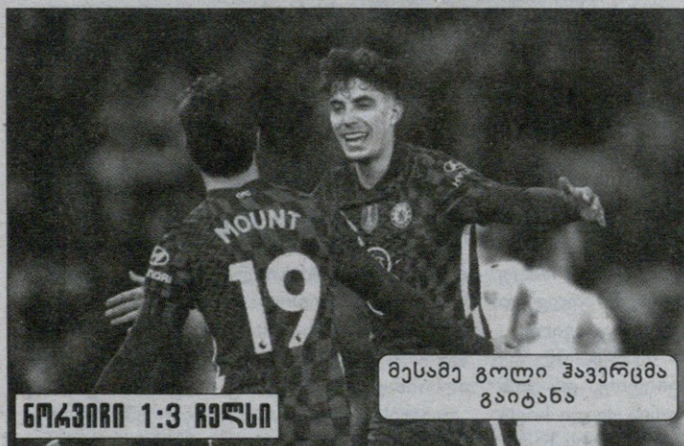
ნორვიჩი 1:3 ჩელსი

ჩელსიმ სტუმრად ნორვიჩს მოუპოვა და ლივერპულთან ჩემპიონატი 7 ქულაზე შეამსობა