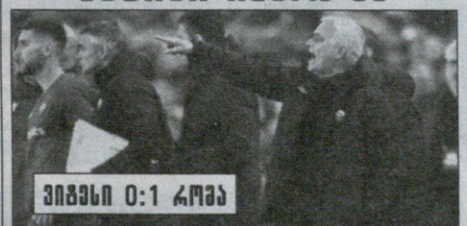
ვიგანი 0:1 კოგამ

მუარინიოს როგამ კონფერენს ლიგაზე 1/8 ფინალის პირველ მატჩში იმარჯვა