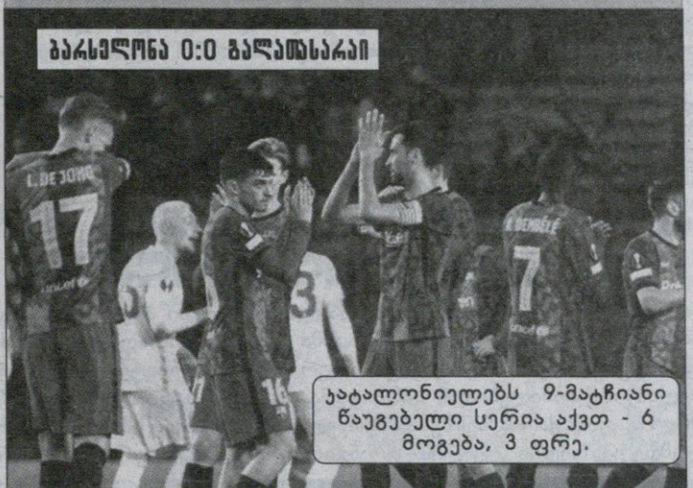
ბარსელონა 0:0 ბალთსაგაი

ბარსელონამ ბოლის ბატანა ბოლო 17 მატჩში პირველად ვერ მოახერხა