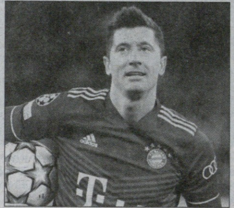
ეს კლუბის ისტორიაში ყველაზე ცუდი გადაწყვეტილება იქნება. ამას ვერაფერი გაიგებს. „ბაიერნმა“ ეს საკითხი ზაფხულამდე უნდა გადაწყვიტოს, — განაცხადა ლევენდოსკმა.

მეტსაც ვიტყვი. თუ „ბაიერნი“ არ შეეცდება მასთან კონტრაქტის გაგრძელებას,