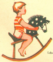
ნახატები თამარ ჩირინაშვილისა

*** მამამ ცხენი მომიყვანა, მოვასკუბდი ბიჭი—გური, მათრას ვურტყამ და ოთახში დავაჭენებ თქარათქურით.