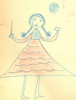
„გოგონა მღერის“—ნახ. ნუცა შანშაშვილი, 3 წ. „ბებო“—ნახ. ანა გვილაძე, გორის რაიონი, სოფ. მერეთი.