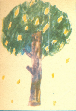
„ბე“—ნახ. ლეო ბარბაქაძე, 9 წ. ხარკოლი. „გოგონა ზეობის“—ნახ. მკა ტატალაშვილი, 5 წ. პორტყაშის რაიონი, დიხა წილკერი. „ბებო“—ნახ. მზა ცხაძეშვილი, 9 წ. თელავის რაიონი, სოფ. რუისკარი.