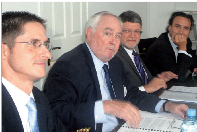
ბაზრძალაბა 80-3 ბავარდუა

საქართველოს ეუთო-ს საპარლამენტო დელეგაცია ეწვია. საპარლამენტო ასამბლეის ახლად არჩეული პრეზიდენტი რიკარდო მილიორი, ვიცე-პრეზიდენტი ტონინო პიცულა, გენერალური მდივანი და დელეგაციის სხვა წევრები წინასაარჩევნო პერიოდში არსებულ ვითარებას გაეცნობიან და პოლიტიკური პარტიების საარჩევნო კამპანიის მიმდინარეობას დააკვირდებიან.