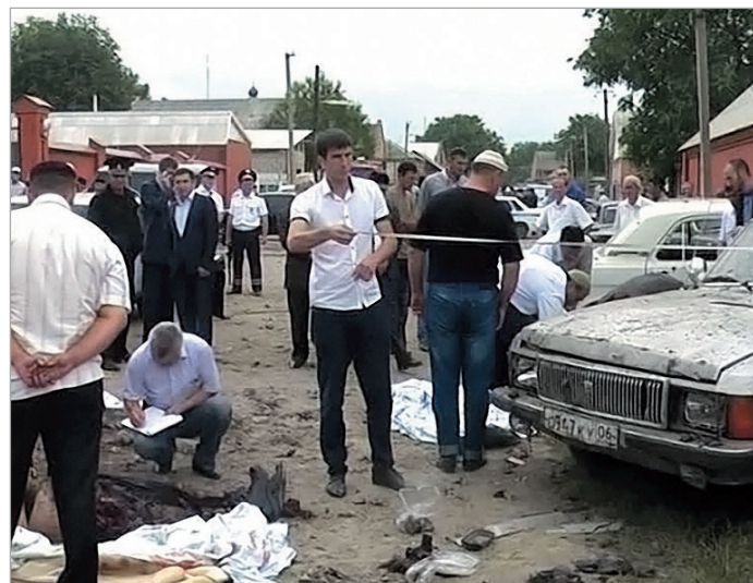
ბაზრძალაბა 80-5 ბავარდუა

კვირას, სოფელ საგომში სამგლოვიარო ცერემონიის დროს მომხდარი აფეთქების შედეგად დაიღუპა 7 პოლიციელი, კიდევ 15 ადამიანი კი დაიჭრა. ისინიც, ძირითადად, პოლიციელები არიან. კრძალავდნენ შაბათს მოკლულ პოლიციელს იღვზ კორიგოვს (ის უზნის ინსპექტორი იყო), რომელსაც უცნობმა პირებმა ცეცხლი გაუხსნეს ქალაქ მალგობეკში. ის დაიჭრა და საავადმყოფოში გარდაიცვალა.