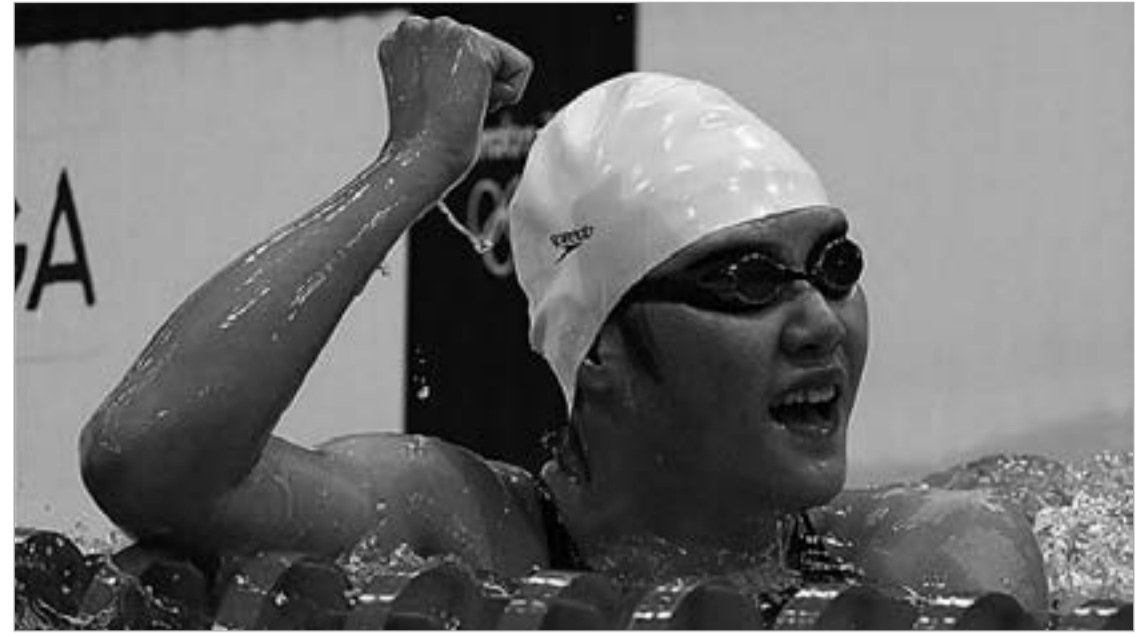
"სპორტსმენი ნომერი 137"-ს ყოველდღე ეუბნებოდნენ, რომ იმისთვისაა დაბადებული, რათა ქვეყნისთვის ოლიმპიური ოქრო მოიგოს

დამავგირგინებელი რგოლია დედაქალაქის ცენტრული სპორტული ცენტრი, რომელშიც მხოლოდ პროვინციის ჩემპიონები და ყველაზე ნიჭიერი სპორტსმენები ხვდებიან.