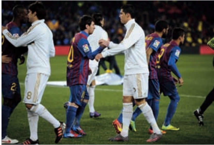
მესი და რონალდუ

გასულ სეზონში ჟოზე მოურინიოს "რეალმა" არაერთი რეკორდი დაამსო, მაგრამ შეძლებს კი "სამეფო კლუბი" შედეგის გამეორებას? საეჭვოა. საქმე ის არის, რომ გასული სეზონისგან განსხვავებით, "ბარსელონაში" ცვლილებებია. გუნდის ორი ქრესტომათიული ლიდერი ჩავიდა პუიოლი კვლავ ადგილზე იქნებიან. ამას დაუმატეთ საოცარ ფორმაში მყოფი ანდრეს ინიესტა, რომელმაც ევროპის ჩემპიონატზე საუცხოო ფეხბურთი აჩვენა. ისიც გასათვალისწინებელია, რომ "ბარსას" დაუბრუნდა დავიდ ვილია, რომელმაც გასული სეზონი ტრაგედიის გამო გამოტოვა. და კიდევ ერთი ფაქტორი. ზაფხულის სატრანსფერო პერიოდში "ბარსელონამ" ხორდი ალბა და ალექს სონგი შეიძინა, "რეალი" კი მხოლოდ ლუკა მოდრიჩით გაძლიერდა. მაგრამ თუ გავითვალისწინებთ, რომ "სამეფო კლუბში" მესუსთ იოზილი თამაშობს, მოდრიჩი, დიდი ალბათობით, სათადარიგოთა სკამის