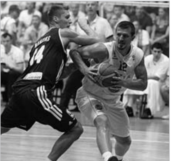
ტელეტოვიჩი ქულებში მეორეა