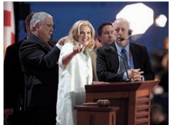
ყრილობაზე სიტყვით გამოვიდა კანდიდატის მეუღლე ენ რომნი

გუშინ ფლორიდის შტატში რესპუბლიკური პარტიის ყრილობა დაიწყო, სადაც მასაჩუსეტსის ყოფილიმა გუბერნატორმა მიტ რომნიმ ნოემბრის საპრეზიდენტო არჩევნებში კანდიდატად დასახელებისათვის დელეგატების ხმების საჭირო რაოდენობა მიიღო. ამერიკის პრეზიდენტობისათვის რესპუბლიკელი მიტ რომნი და დემოკრატი, ამერიკის მოქმედი პრეზიდენტი ბარაკ ობამა იბძობლებენ.