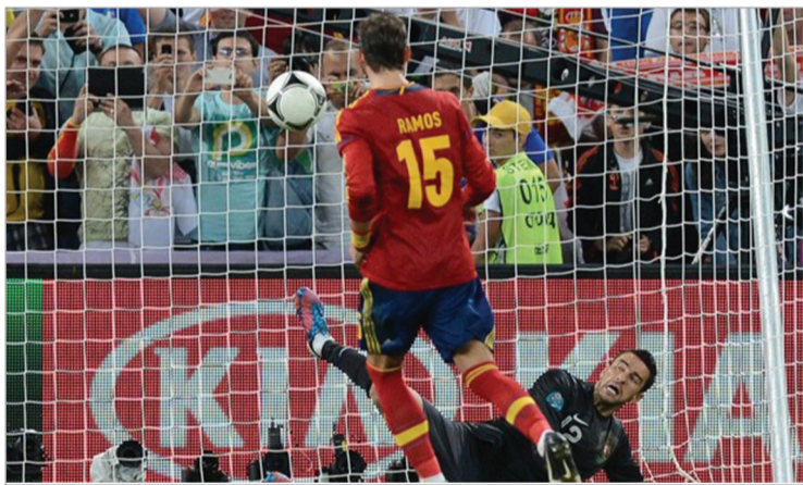
სერხიო რამოსის პენალტი

ესპანელთა მეკარემ იკერ კასილიასმა თქვა, რომ გაკვირვებული დარჩა, როდესაც რომალდუ პენალტის ნიშნულთან არ მივიდა, თუმცა, ისიც დაამატა, რომ პენალტების სერიაში ის რონალდუზე არ ფიქრობდა.