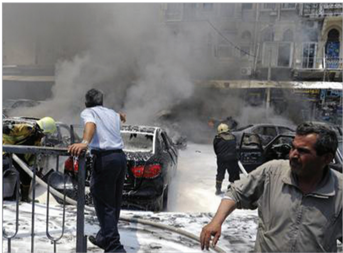
აფეთქება იუსტიციის სასახლესთან დამასკოში