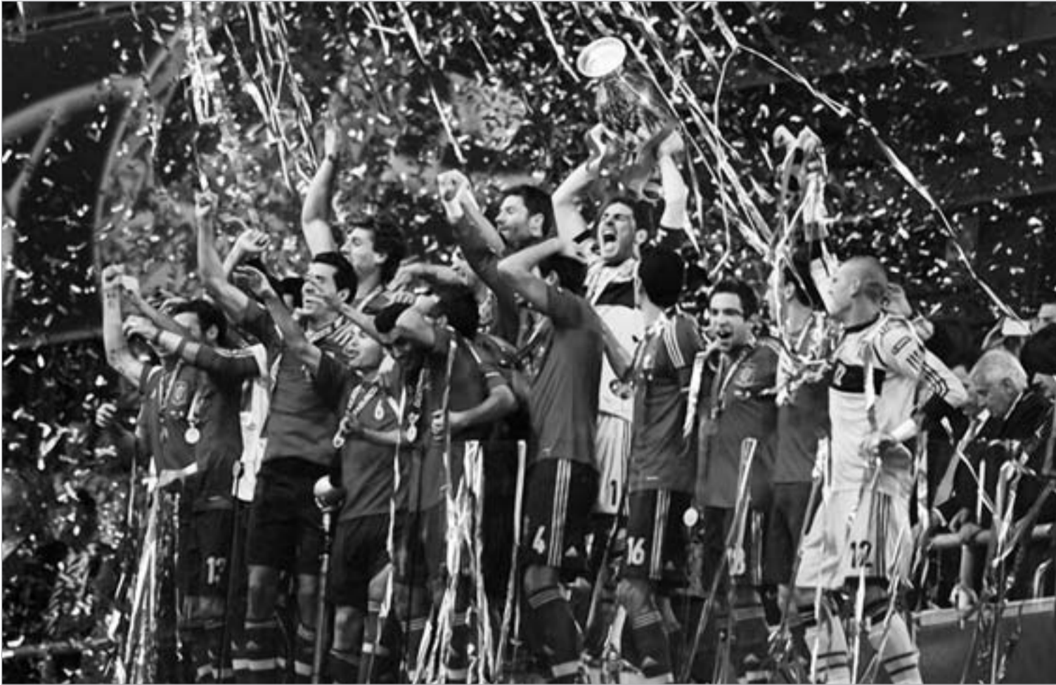
ესპანეთის ნაკრები მორიგ ტიტულს ზეიმობს