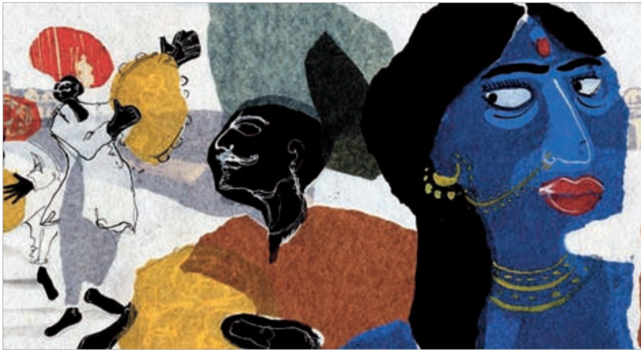
შარშანდელი გამარჯვებული ფილმი "ამარ"

"თოფუზი" არ გახლავთ მხოლოდ ფილმების ჩვენება და გამარჯვებულთა დაჯილდოება. მისი უმთავრესი მიზანია, ხელი შეუწყოს შემოქმედებითი გამოცდების გაცვლას, ახალი იდეების ძებნასა და, რაც მთავარია, ქართული ანიმაციის ინტეგრაციას მსოფლიო კინოს სამყაროში. კონკურსის გარდა, ფესტივალის ფორმატი ფილმების ჩვენებასა