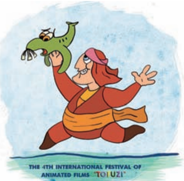
THE 4TH INTERNATIONAL FESTIVAL OF ANIMATED FILMS 'TOFUZI'

სამხრეთ კავკასიის ქვეყნებში სულ სამი კინოფესტივალია, აქედან ორი საქართველოში ტარდება - ზამთარში თბილისის საერთაშორისო კინოფესტივალი, ხოლო ადრინამ შემოდგომაზე ბათუმი საავტორო კინოს მასპინძლობს. როგორც კი ამ ზღვისპირა ქალაქში საერთაშორისო სეზონი მიიწურება, კიდევ ერთი ფესტივალი, ამჯერად - ანიმაციური, აიღებს სტარტს. ასე გრძელდება უკვე მეოთხე წელია, ფესტივალს კი "თოფუზი" ჰქვია. მართალია, ფესტივალის ჩატარებამდე ჯერ კიდევ დიდი დროა დარჩენილი, ორგანიზატორებმა უკვე გამოაცხადეს საკონკურსო ნამუშევრების მიღება, რომელთა ჩაბარების ვადა 31 ივლისს იწურება.