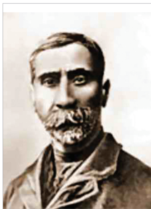
ბაზრძალაბა 8A-5 გვერდი

ყველას ჩვენი ფიროსმანი გვყავს - მის მიხედვით, როდის, რა ასაკში, რა განწყობით აღმოვაჩინოთ მას.