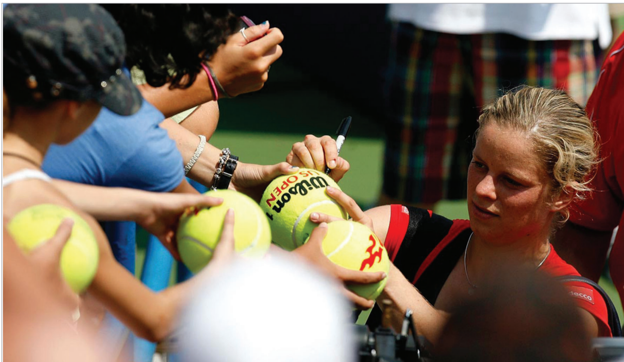
კიმ კლაისტერსმა კარიერა დახურა

2009. კლაისტერსი ჩადის ნიუ იორკში. ნაუსეშენა ჯეიმს ჰეთფილდთან ერთად. გაასწორა, საინტერესო იყო. ჯეიმსთან ერთად ყოველთვის საინტერესოა. ჩავიდა კორტზე, ნაივარჯიშა და დაუმესიჯა US Open-ის ბოსებს, თუ არ გაგიტყდებოდათ, ძირითად ბადეში ჩამსვით და სადღაც, მესამე წრემდე ყველა ვარიანტში გავქაჩავო. ბოსებმა მაკაგონის კარი გამოიხურეს, ნაითათბირეს და კიმი ძირითადში ჩასვს.