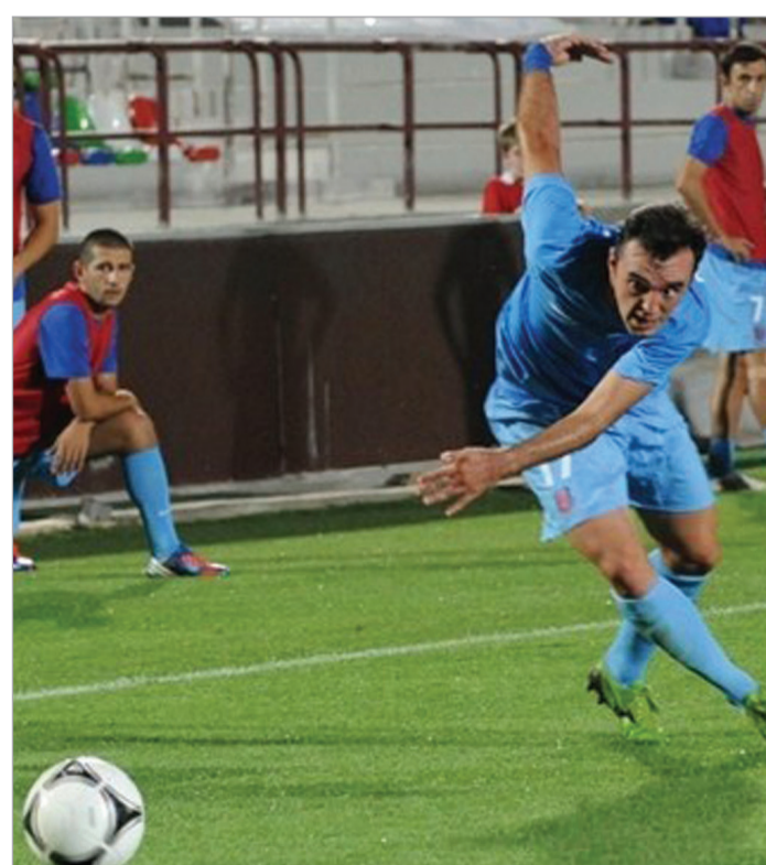
გურულის მცდელობები უშედეგო გამოდგა

გორის "დილამ" ქართველ ქომაგს იმედის ნაპერწკალი ჩაუსახა. თავად განსაჯეთ, გუნდმა, რომელიც ქართული საკლუბო ფეხბურთის გრანდებსაც კი არ განეკუთვნება, ევროპის ლიგის საკვალიფიკაციო ეტაპზე ორი რაუნდი დამაჯერებლად გადალახა და ამ გუნდს ოდნავ მეტი გამოცდილება რომ ჰქონოდა, წესით "მარიტიმუსაც" გაივლიდა და ჯგუფურ ეტაპზეც მოხვედებოდა.