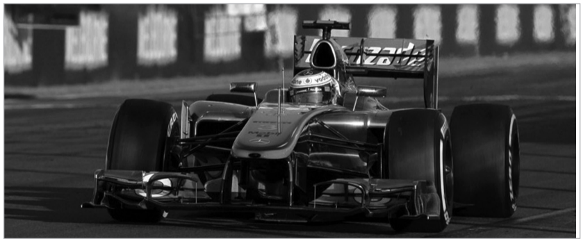
ბატონი იქამდე აპირებს ბრძოლას, ვიდრე ჩემპიონობის შანსი ექნება

სამეფო რბოლებში საზაფხულო არდადეგების დასრულება უქმეებზე ბელგიის "სპა ფრანკოშამის" ეტაპის დაწყებით აღინიშნება. ფორმულა 1-ის სეზონის დასრულებამდე საჯინიბოებს ცხრაჯერ მოუწევთ ბოლიდების ტრასებზე შეგორება. მანამდე კი ჩემპიონთა დავაში ლიდერობს "ფერარის" ესპანელი მრბოლი ფერნანდო ალონსო, რომელსაც 88 ქულით ჩამორჩება მაკლარენელი ჯენსონ ბატონი. ესპანელის დიდი უპირატესობის მიუხედავად, ბრიტანელი ფარ-ხმალს არ ყრის. პირიქით, იქამდე აპირებს ბრძოლას, ვიდრე ჩემპიონობის შანსი ექნება.