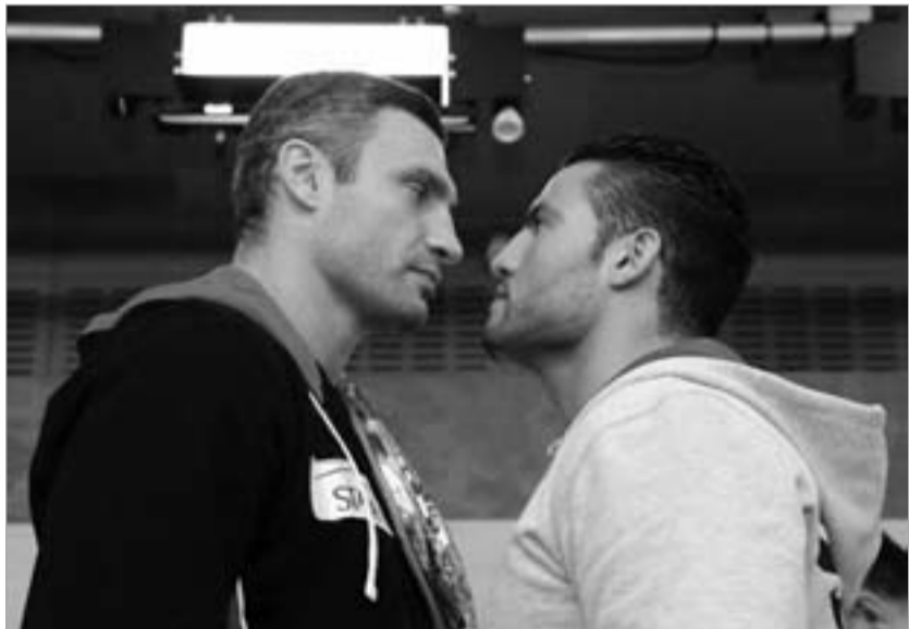
ვიტალი კლიჩკოს ჩართან დაჯორიდად მიიჩნევენ

- ამისთვის რა არის მთავარი? - სიმამაცე. - რატომ დატოვეთ კლუბი Universum (გერმანული საპრომოუტერო კომპანია) და, დიდი ფინანსური რისკის მიუხედავად, გახსენით