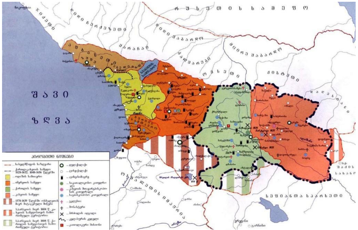
რუკა III. : საქართველო (1578 – 1639 წლებში)