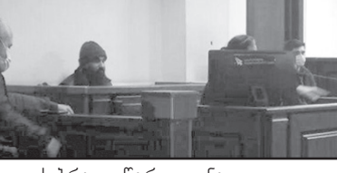
ვ.გ.-მ სექსუალური ორიენტაციის ნიშნით შეუწყინარებლობის მოტივით, რ.მ.-ს ნების საწინააღმდეგოდ, უკანონოდ მოპოვდა და შეინახა ამ უკანასკნელის პირადი ცხოვრების საიდუმლოს ამსახველი ინფორმაცია, ვიდრეწინააღმდეგობის სახით, რაც ინტერნეტის მეშვეობით ასევე უკანონოდ გავრცელდა.

შინაგან საქმეთა სამინისტროს მიერ ჩატარებული გამოძიებით დადგინდა, რომ გ.გ.-მ, სექსუალური ორიენტაციის ნიშნით შეუწყინარებლობის მოტივით, რ.მ.-ს მიმართ განახორციელა დამამცირებელი მოპყრობა, კერძოდ, ძალადობის მუქარით ამ უკანასკნელს გაპარსა წვერი, გახადა სასულიერო პირის შესამოსელი, რითაც ღირსების შემლახავ მდგომარეობაში ჩააყენა რ.მ. ვ.გ.-მ, სექსუალური ორიენტაციის ნიშნით შეუწყინარებლობის მოტივით, რ.მ.-ს მიმართ რამდენჯერმე განახორციელა ფიზიკური ძალადობა და დაეპყრა სიცოცხლის მოსპობით თუ კვლავ ჩაეჭყვინდა სასულიერო პირის შესამოსელს, ამ მიზეზით მან თვითნებურად გახადა, წაართვა და აუკრძალა მისი ჩაცმა.