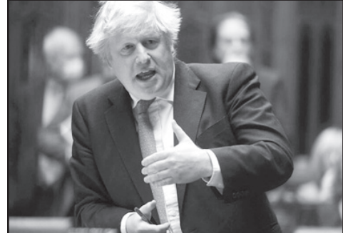
ყულის სტატუსი, რომელსაც ეს ომი პუტინის რეჟიმს მოუტანს, — განაცხადა ჯონსონმა.

და ბომბი აწვიმდა სრულიად უდანაშაულო მოსახლეობას. ფართომასშტაბიანი შეჭრა ხდება ხმელეთის, საჰაერო და საზღვაო გზით. ჩვენი ყველაზე საშიშელი შიშები ახლა ახდა და ყველა ჩვენი გაფრთხილება ტრაგიკულად ზუსტი აღმოჩნდა. დაწესებული იქნება მასშტაბური ეკონომიკური სანქციები რუსეთის მიმართ, უკრაინაში შეჭრის გამო, რომელიც დროულად არის შემუშავებული, რუსეთის ეკონომიკის შეფერხებისთვის, — განაცხადა ჯონსონმა. — ამასთან, ბორის ჯონსონმა მის სატელევიზიო მიმართვაში რუს ხალხსაც მიმართა. — არ მჯერა, რომ ეს ყველაფერი თქვენი სახელით გაკეთდა, ან რომ თქვენ გსურთ გარი-