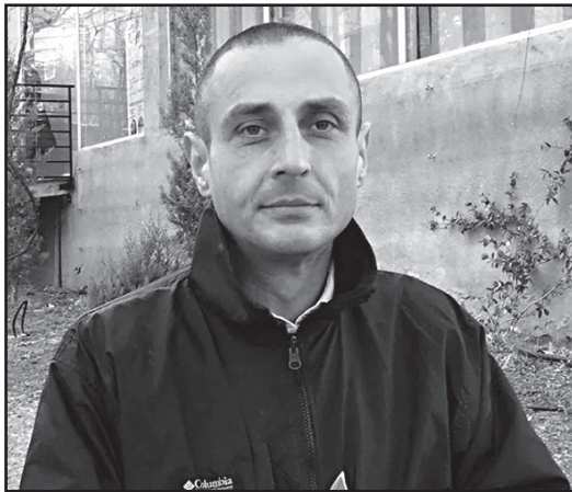
უკრაინელი ხალხისთვის პუმანიტარული დახმარება? რა შეგვიძლია ამ კუთხით?

ასე თუ გაგზავნით და პირში წყალს ჩაგიგუბებთ, მსოფლიო დაგვივიწყებს. ჩვენი ხელისუფლების გარეშე დასავლელი ლიდერები მთელი ეს პერიოდი საქართველოს მაგალითი საუბრობდნენ, მაგრამ დროა ჩვენმა ლიდერებმა ისაუბრონ ჩვენს ოკუპაციაზე, მცოცავ ანექსიაზე, იმაზე, რომ რუსული ჯარი დგას თბილისიდან 20 კილომეტრში. ამაზე უნდა