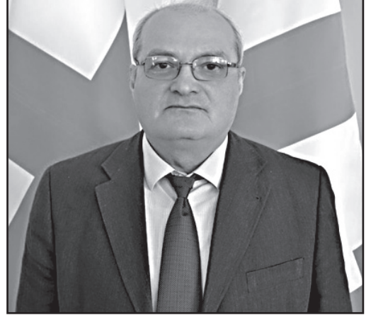
ტიმის ლიციშვილიც შეაჩერა. თუმცა, რუსეთს დარჩა სხვა გზები, რითაც გაზს გაიტანს უცხოეთში.

– ლუგანსკისა და დონბასის აღიარებასა და იქ ჯარის ღიად შეყვანის გამო, რუსეთს სანქციები დაუწესდა. გერმანიის კანცლერმა „ჩრდილოეთ-ნაკადი-2“ გახსადენის პროექტს