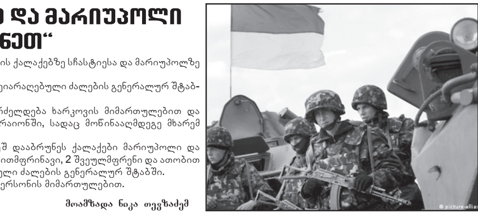
მოამზადა ნიკა თევზაძემ

უკრაინელმა სამხედროებმა ლუგანსკის ოლქის ქალაქებზე სჩასტია და მარიუპოლზე სრული კონტროლი აღადგინეს. ინფორმაციას უკრაინული მედია უკრაინის შეიარაღებული ძალების გენერალურ შტაბში დაყრდნობით ავრცელებს. მისივე ინფორმაციით, მძიმე ბრძოლები გრძელდება ხარკოვის მიმართულებით და უკრაინის გაერთიანებული ძალების ოპერაციის რაიონში, სადაც მოწინააღმდეგე მხარემ დანაკარგი განიცადა. — ჩვენმა ძალებმა სრული კონტროლის ქვეშ დააბრუნეს ქალაქები მარიუპოლი და სჩასტია. განადგურებულია მტრის სულ მცირე 6 თვითმფრინავი, 2 შეველმფრენი და ათობით ჯავშანმანქანა, — აცხადებენ უკრაინის შეიარაღებული ძალების გენერალურ შტაბში. შტაბის ცნობით, ასევე, რთული ვითარებაა ხერსონის მიმართულებით.