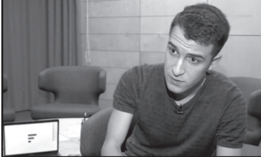
ამასთან, დანაშაული 2-დან 6 წლამდე ვადით თავისუფლების აღკვეთას ითვალისწინებს. გამოძიება განსაკუთრებით მძიმე დანაშაულის წინასწარ შეუპირებლად დაფარვის ფაქტზე, სისხლის სამართლის კოდექსის 375-ე მუხლის მე-3 ნაწილით მიმდინარეობს. – აღნიშნულია უწყების განცხადებაში.

სამინისტროს ინფორმაციით, ი.ბ.-მ პოლიციას ამის შესახებ არ შეატყობინა.