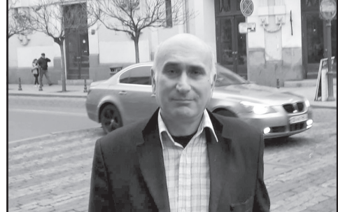
– უკრაინიდან წითელ ჯვარს მოუწოდებს ჩართოს და რუსების ცხედრები გადაიტანოს რუსეთში.

არ მოელოდნენ, რომ კიევზე ტოტალური შეტევა განხორციელდებოდა და ყველა მოუშხადებელი შეედა. კიევის სიახლოვეს ხიდი რომ ააფეთქეს, ეჭვობენ, რომ ჩეჩნური ბატალიონი იბრძოდა. ხელნართულ ბრიგადებს ელოდებიან. იქნებ რაღაც პერიოდში გზა გაიხსნას. იმედი მაქვს, ეს კომმარო დიდხანს არ გაგრძელდება. ბავშვების სიცოცხლე გადასარჩენია. შეიძლება, ინფორმაცია არ მაქვს, მაგრამ, კარგი იქნებოდა, წითელ ჯვარს დერეფანი გაეხსნა და ბავშვებისა და მოსუცების გაყვანის გარანტია ყოფილიყო.