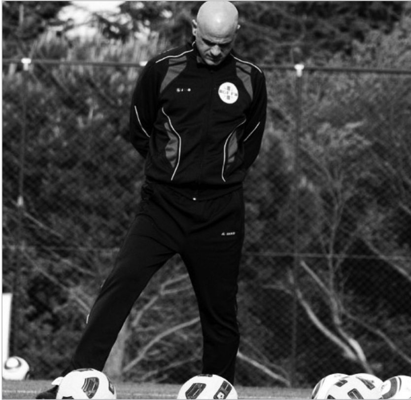
ქეცბაიას გუნდი ზედიზედ მე-4 დამარცხდა