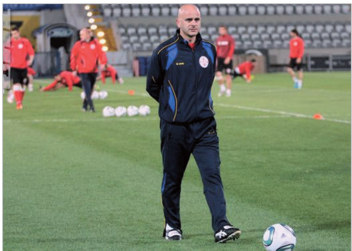
ყაზახეთთან პირველად წაგვით