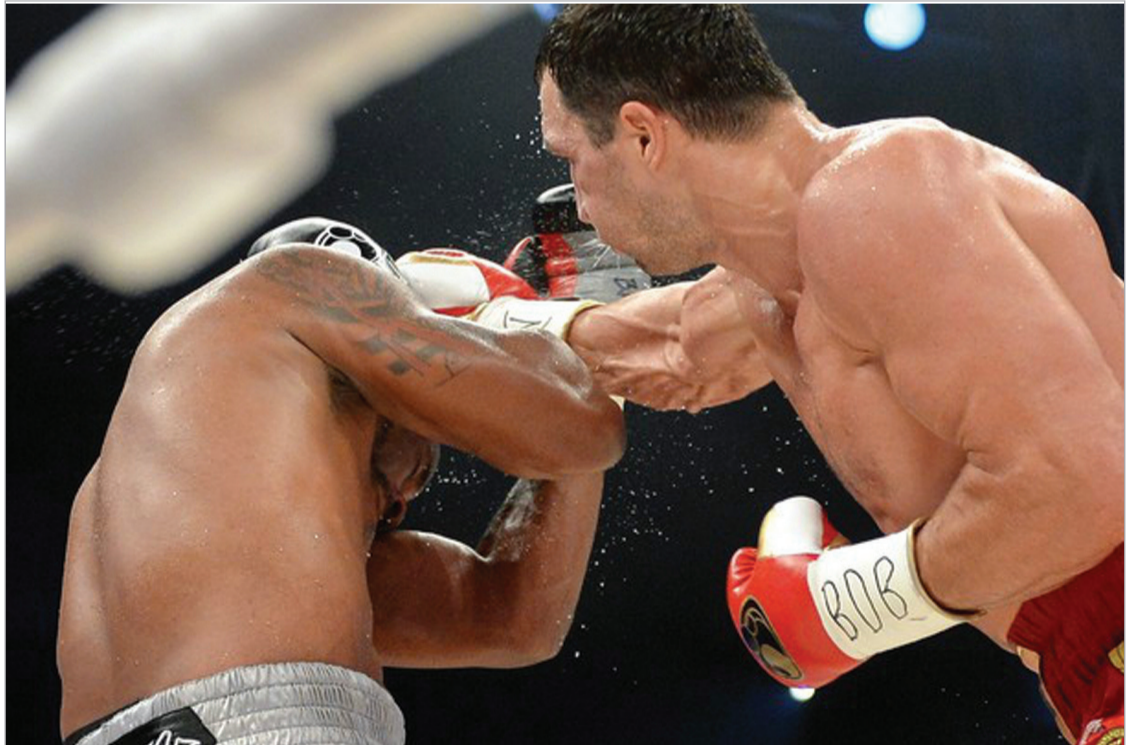
კლიჩკოს მუშტებთან უძლური ტომპსონი მეექვსე რაუნდში ტექნიკური ნოკაუტით დამარცხდა

ვლადიმერ კლიჩკომ ტრადიციულად აღნიშნა მეტოქის ძალა და იქვე იწინასწარმეტყველა, ადვილი ბრძოლა არ იქნებაო. ვლადიმირის მამა, კრივის მსოფლიო საბჭოს ჩემპიონმა ვიტალიმ კი "ფეისბუქზე" დაწერა, დიდი ბრძოლა იქნებაო. მძევი კლიჩკოების ვარაუდი არ გამართლდა. პირველი რაუნდში გამოიკვეთა ვლადიმირის უდავო უპირატესობა. მან ამერიკელს არავითარი შანსი არ მისცა. მხოლოდ ის იყო