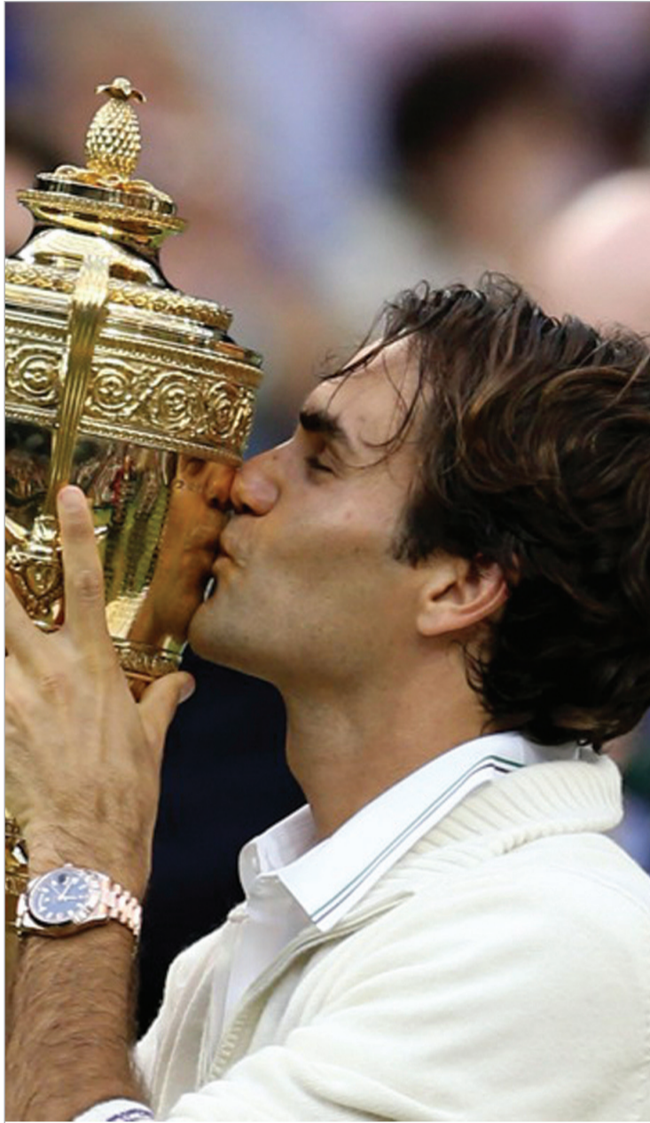
ჩოგბურთო ვუდსტოკი წავიდა და როჯმა ჯო კოკერივით დაგლიჯა. მარი დადლილი ჯენის ჯოპლინი იყო. როჯერი მერვედ გადის უიმბლდონის ფინალში და მემ-