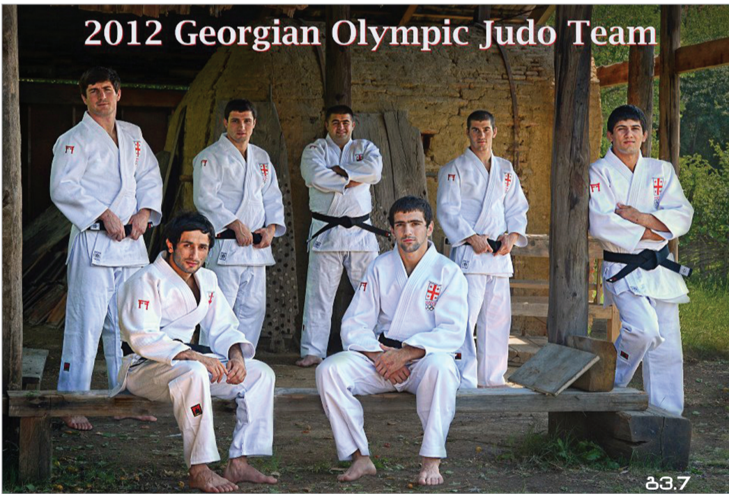
2012 Georgian Olympic Judo Team