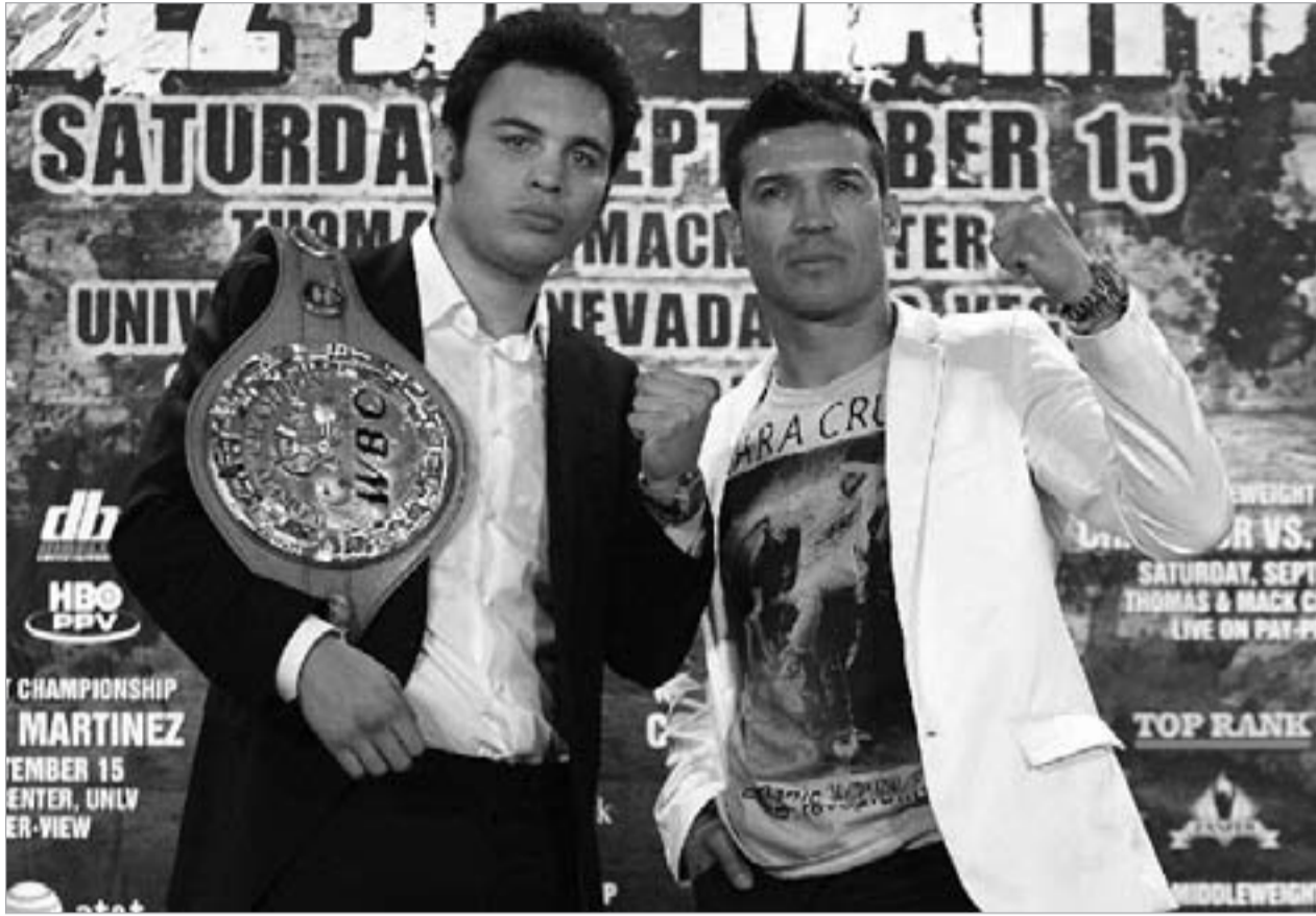
ჩავეს-უმცროსი და მარტინესი WBC ქამრისთვის ლას ვეგასში იჩხუბებენ

ამ უქმეებზე საშუალო წონაში კრივის მსოფლიო საბჭოს ჩემპიონს საბჭოს ბრილიანტის სარტყელის მატარებლის, სერხიო მარტინესის სახით სახიფათო მეტოქე ელის. ერთი არგენტინელს წინაინ კატეგორიების მიუხედავად საუკეთესო მოკრივედ თვლიან. სერხიო მარტინესის მიმართ ასეთი დამოკიდებულება აქვს გავლენიან The Ring,