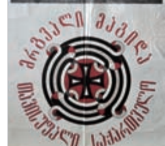
ბაზრქალაბა მე-5 გვერდზე