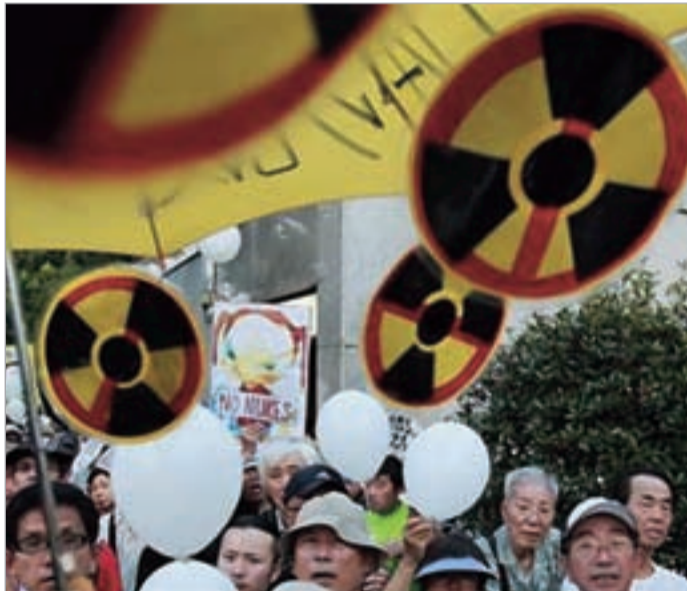
ბაზრქალაბა მე-4 გვერდზე

2011 წლის 11 მარტის კატასტროფამდე იაპონია მსოფლიოში ატომური ენერჯიის მესამე უმსხვილესი მომხმარებელი იყო.