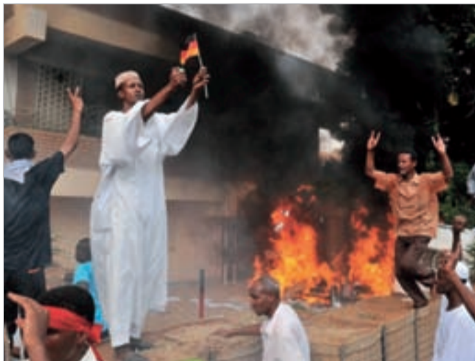
ბაზრქალაბა მე-4 გვერდზე

ისლამურ სამყაროში არეულობა? მეხუთე დღეა გრძელდება და ძალადობაც სულ უფრო მატულობს. ანტიმუსლიმური ფილმის "მუსლიმთა უმანკოების" გამო პირველი იერიშები უკვე ევროპული სახელმწიფოების დიპლომატიურ მისიებზეც მიექცა. გამძვინვარებული ბრბოს სამიზნე სუდანში გერმანიისა და დიდი ბრიტანეთის საელჩოები გახდნენ.