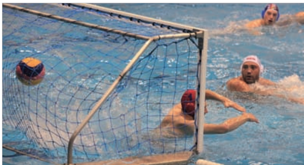
"ლიგამუსმა" ტურნირი გამარჯვებით დაიწყო