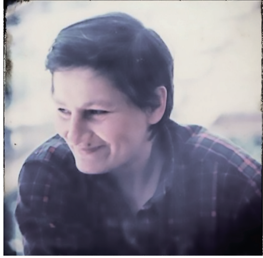
хыраара рыгара, ашэаргара ралгара...

Шьамтэыла, Германия, Голландиа, Франция, Урыстэыла ухэа ркнытэ. Тьркэтэылантэ иааз агэыц ду журналист ха-сабла дрыщын Биргиуль. Аизара амцапысшыа иазкны ажэабжкэа си-зылгон, асахъакэа тьлхуан. Ашытахь Тьркэтэылака ильпытит, аха лара лхата сищыз агэыц аныхынхэуаз дрыщымцакэа Ацсны даангылеит.