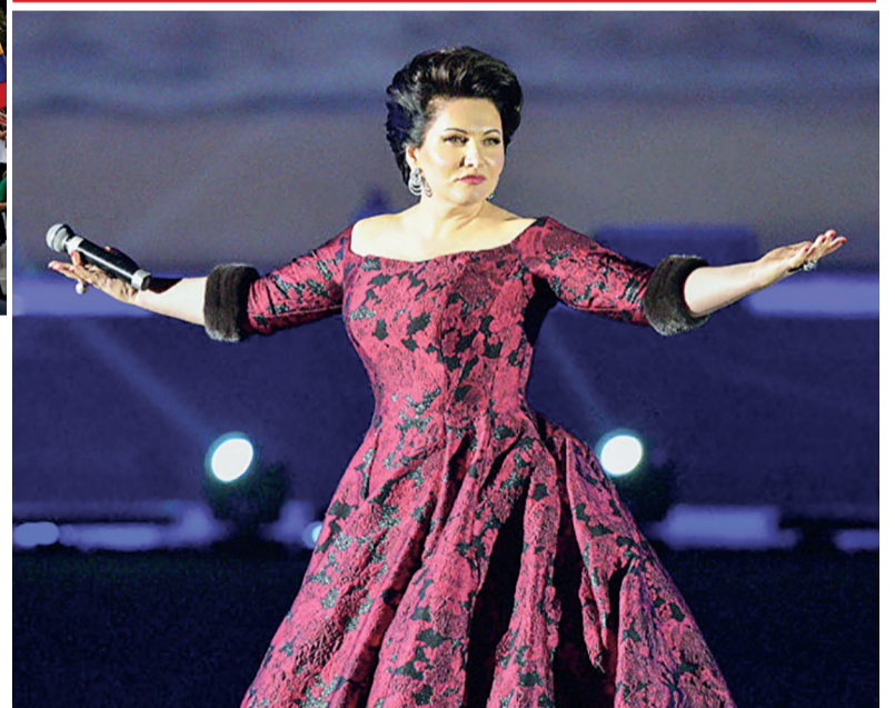
Народная артистка Абхазии и России Хибла ГЕРЗМАВА приехала в Сухум поздравить песней "Абхазия моя".