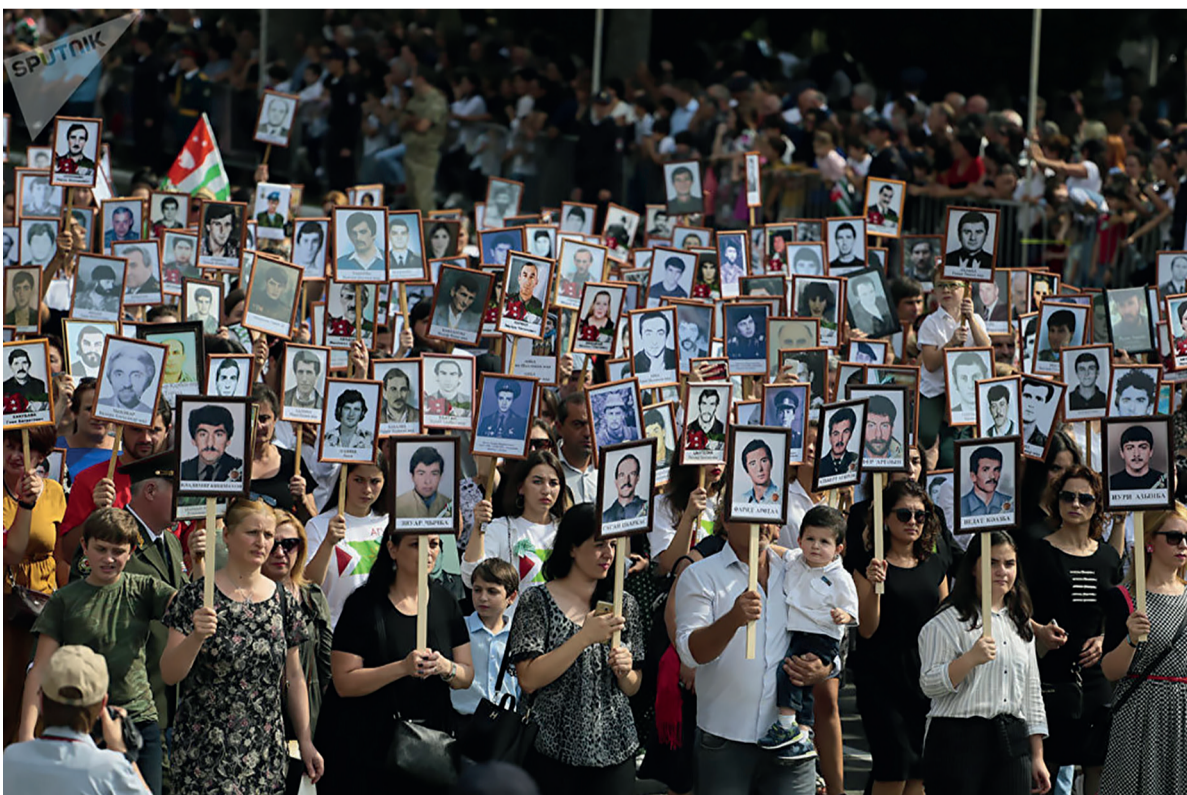
Взрослые и дети с портретами погибших прошли по главной площади столицы