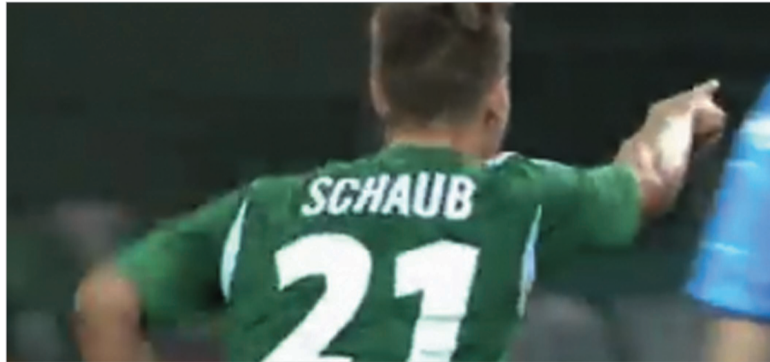
შაუბმა ანგარიში გახსნა

«დილა» უფრო ინდივიდუალურ ყაიდაზე იყო მოწყობილი. ილურიძე, დოლიძე ცდილობდნენ ერთი-ერთზე ეჯობნათ მცველებს და ისე შეეცადათ სტუმარ-