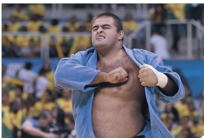
ოქრუაშვილმა ოქროს წერტილი დასვა