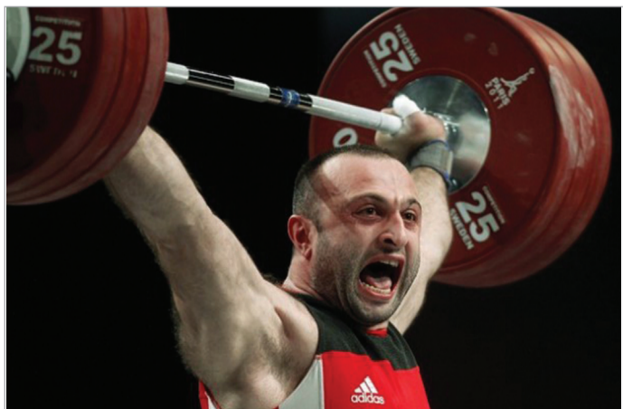
ბაზრძალაბა მე-7 გვერდი

და აკერაში მოპოვებული მცირე ვერცხლის მედლები და ორჭიდის ჯამში ჩემპიონობა ამის თქმის საფუძველს იძლევა, ისევე როგორც ირაკლი თურმანიძის (+105 კგ.) მიერ ატაცში მოპოვებული მცირე ოქროსა და ორჭიდის ჯამში ბრინჯაოს მედალი.