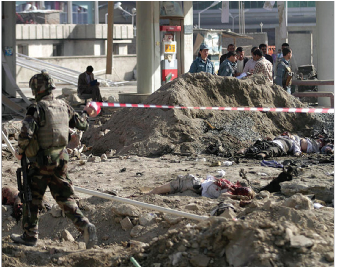
და პროტესტი ავღანურად