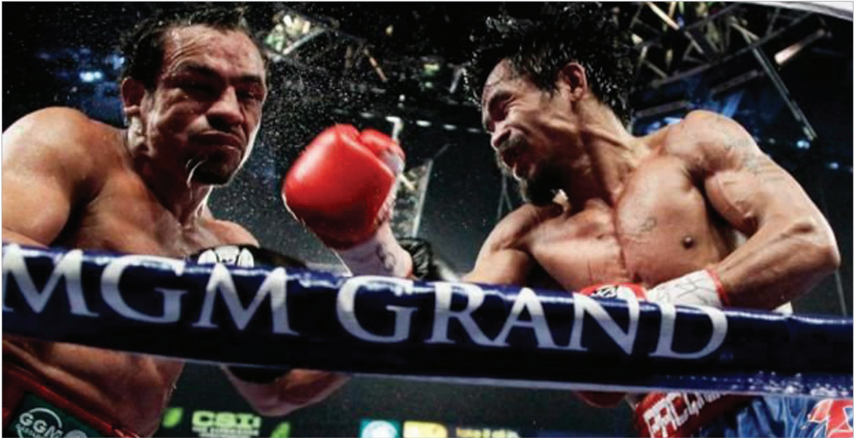
გადანწყვეტილია მარკესი VS პაკიო მეოთხედ!

"ყოველთვის მეგონა, რომ პაკიო (54 მოგება, აქედან 38 ნოკაუტით, 4 ნაგება და ორიც ფრე) აღარ დამიპირისპირდებოდა, - მარკესს