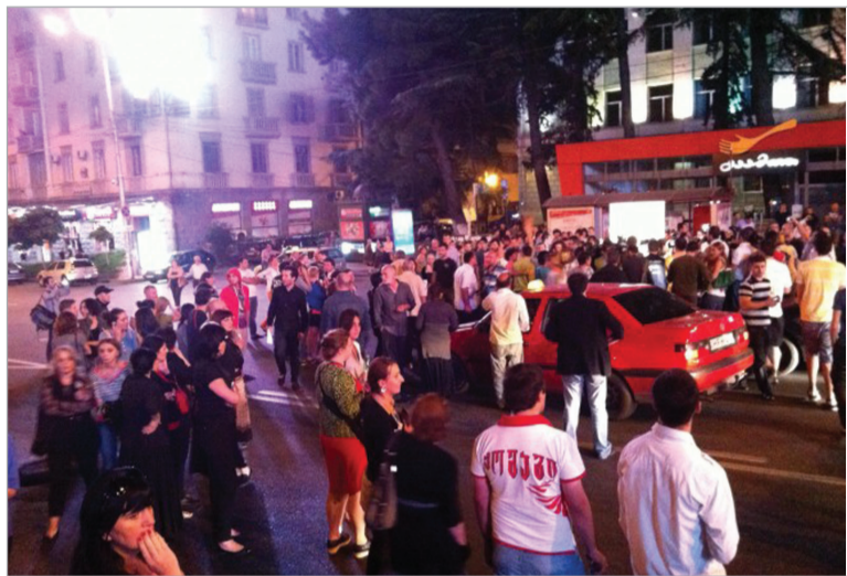
საპროტესტო აქცია ფილარმონიასთან.