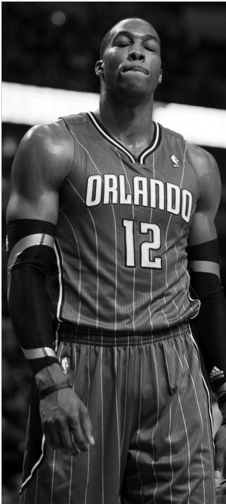
დუაიტ ჰოვარდი "ლეიკერსში" მიდის

დუაიტის CV ამბობს, რომ ჰოვარდი სამჯერ (2009-11) რეგულარულის საუკეთესო დამცველი იყო. იქვე წერია: ექვსე ზის (2007-12) ოლსთარელი, ხუთე ზის (2008-12) ლიგის პირველი ხუთეულის ცენტრი, ოთხე ზის (2009-12) დამცველების პირველი ხუთეულის ცენტრი. ჰოვარდი წინა ოლიმპიადზე გაერთო და კოლექციაში ოლიმპიური ბონუსიც ჩაუშვა. დუაიტი ნორმალურად რეპავს, იშვიათად უსმენს ინტელექტუალურ მუსიკას და იშვიათად თამაშობს ინტელექტუალურ კალათბურთს. ჰოვარდი რეალური ტერორისტია. ბიჭი "ლეიკერსში"