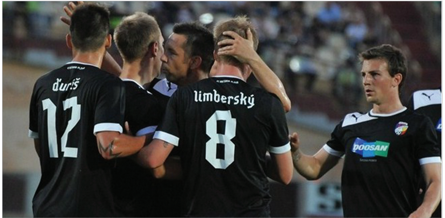
“პლზენი” ჰორვატის გოლს ზეიმობს